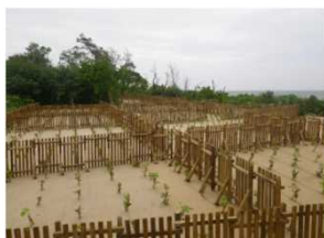
海岸防災林造成(白保)