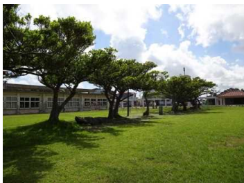
平成26年度 学校環境緑化の部 特選 宮良小学校