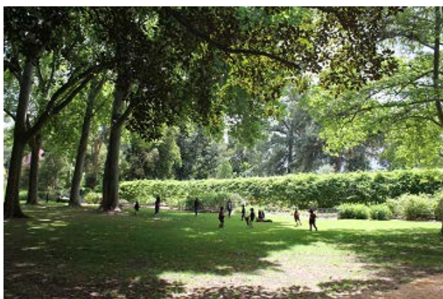
図V-6 ボタニカルガーデン