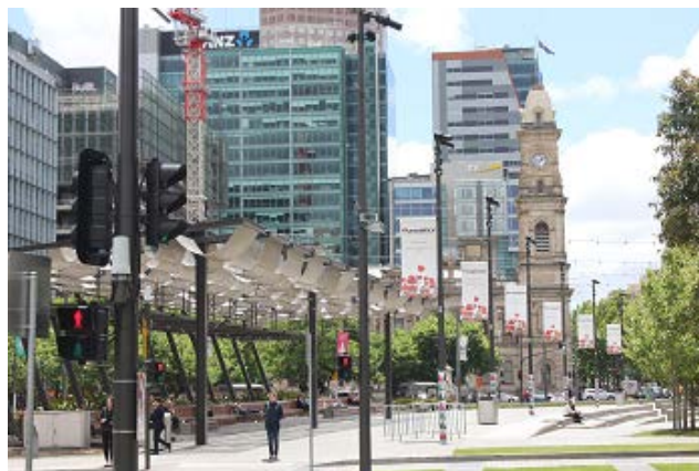
図V-7 ビクトリア公園