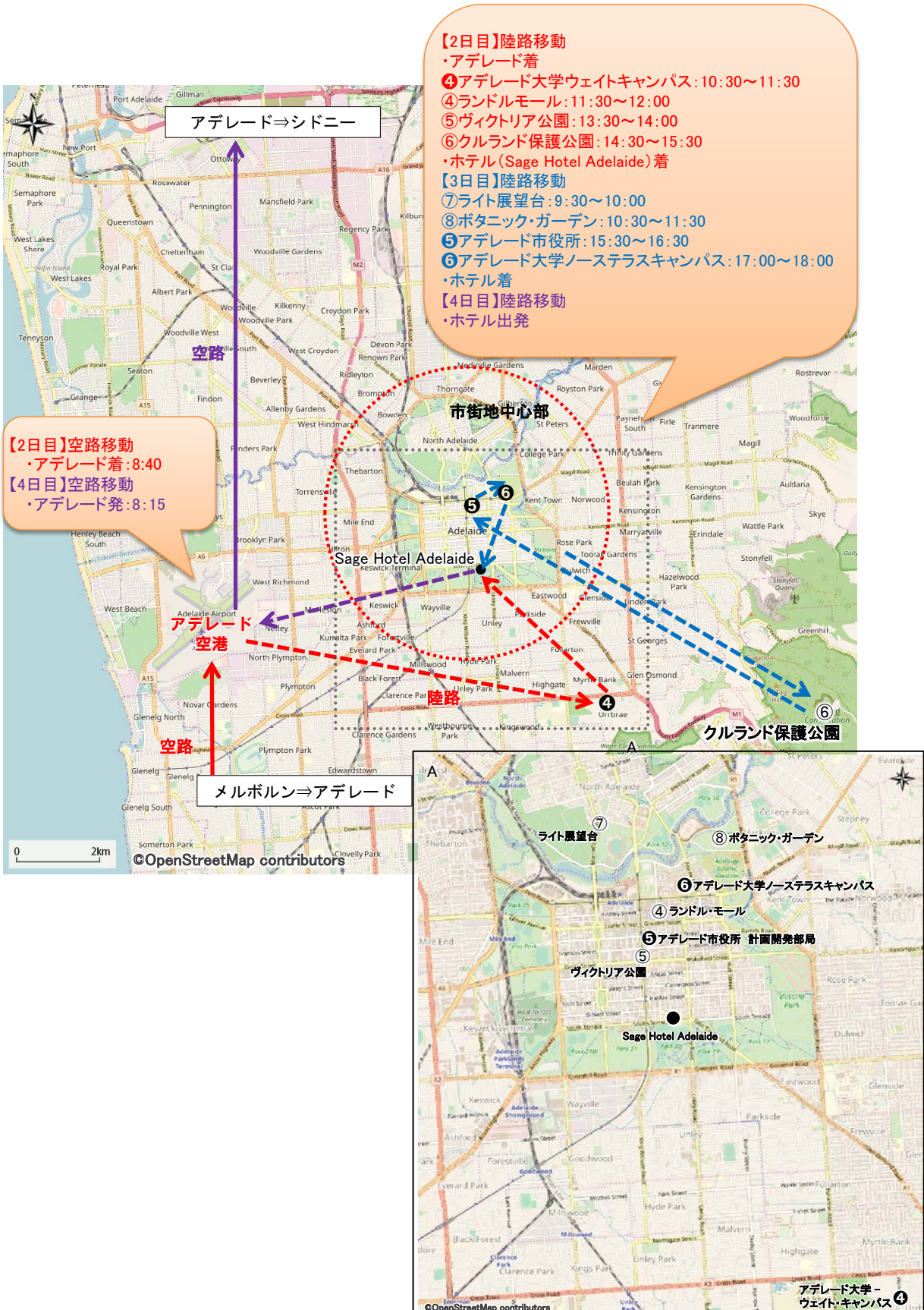
図V-2 訪問先の詳細（アデレード）