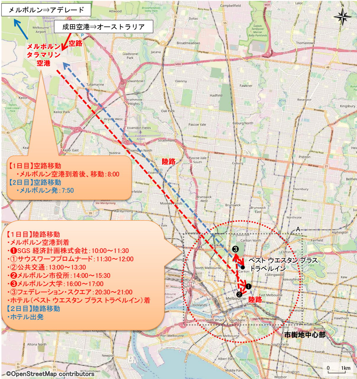
図V-1 訪問先の詳細(メルボルン)