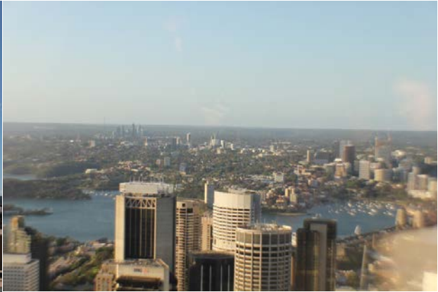
図V-9 高層ビルからのシドニー市街地の眺め