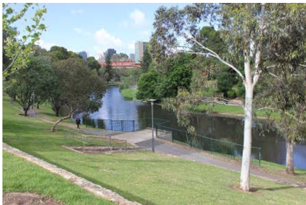
図V-4 アデレードオーバル周辺