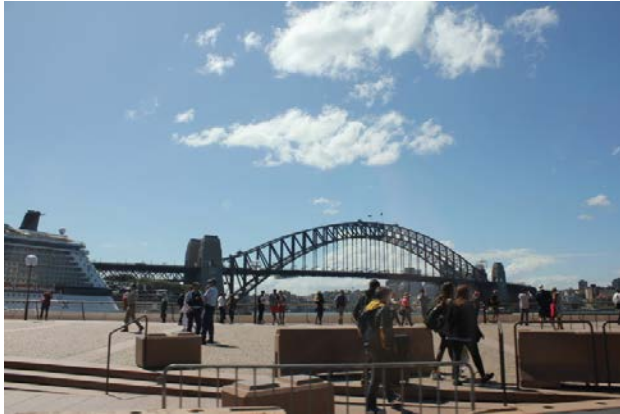
図V-8 サーキュラー・キー