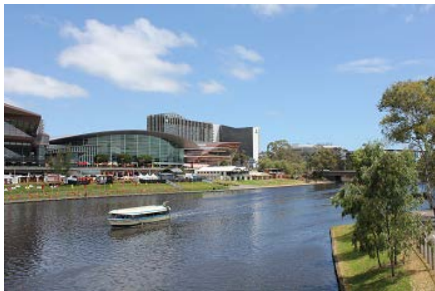
図V-5 アデレードオーバル周辺