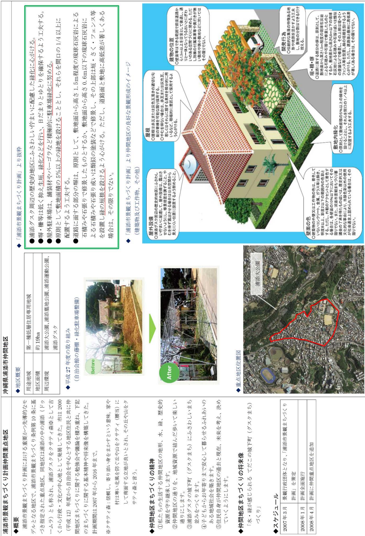
図Ⅱ-41 浦添市景観まちづくり計画仲間重点地区の事例