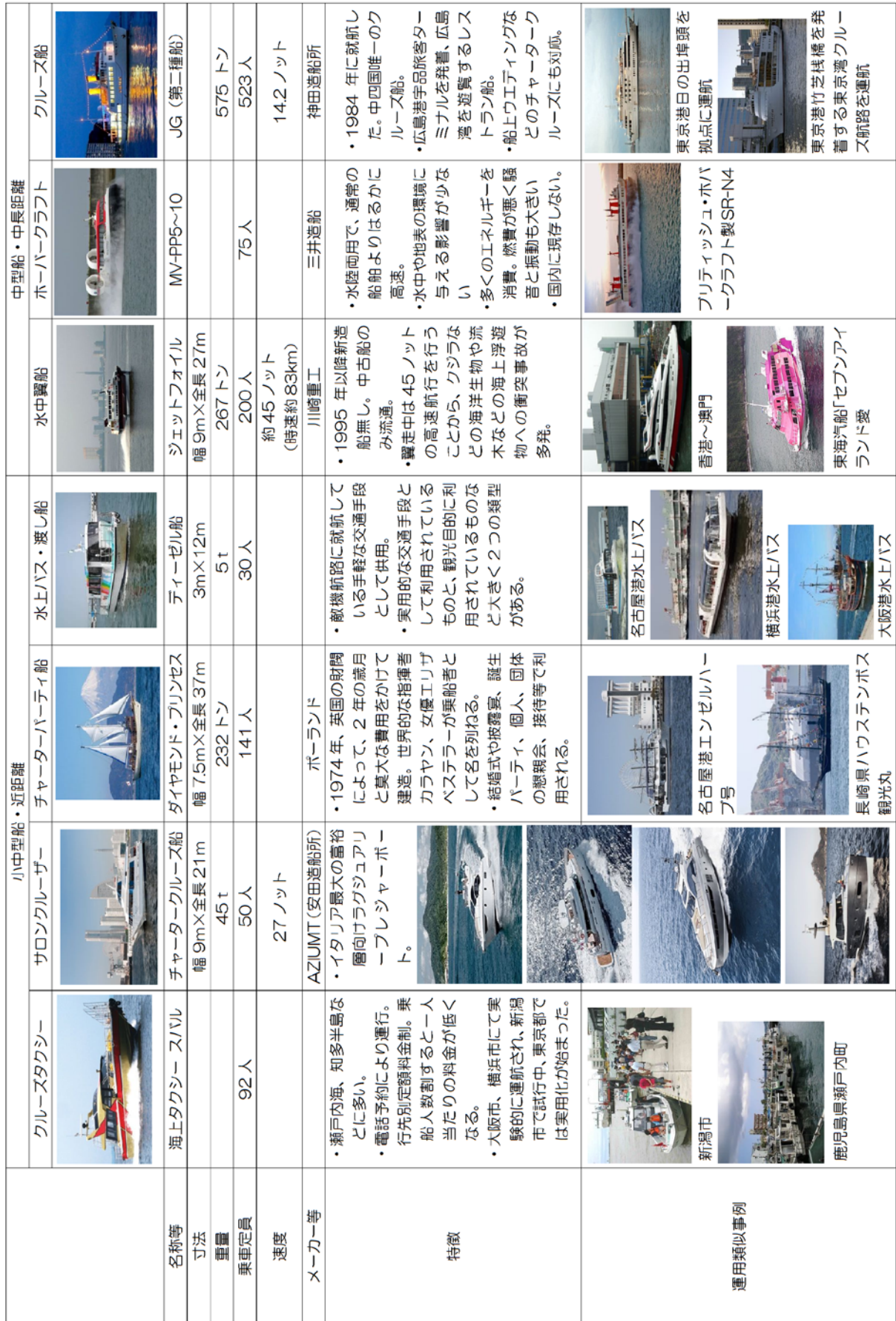
表 II-1: 海運の種類(小型、大型船、距離別、形態別)の定員、速度等