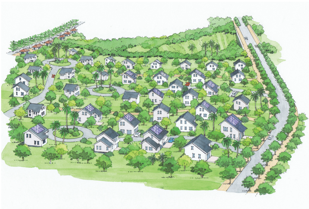
ライフスタイル提案型の住宅地開発（約 10h a） （豊かな緑、環境共生、住民交流等をテーマとして、新しい来住者にアピール）