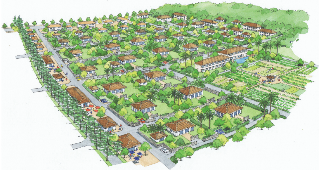
集落空間再生型の住宅地開発（約 10h a） （旧集落に特有の街並みを活かしつつ、今日の生活の場として再生）