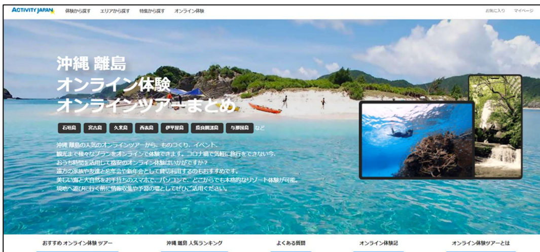
PC 版トップページバナー