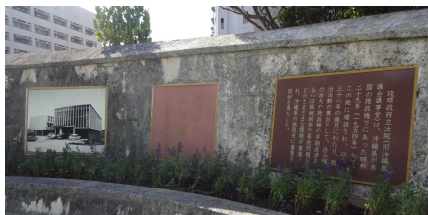
▲ 現在の琉球政府立法院跡地

琉球政府章典（米国民政府布令第68号）の公布により、奄美群島を含む沖縄全域を統合した中央政府である琉球政府の立法機関として設置