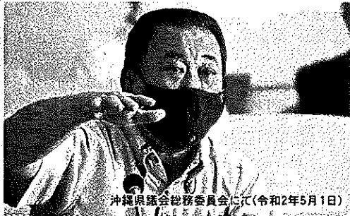
沖縄県議会総務委員会にて(令和2年5月1日)

沖縄県議会は令和2年5月1日に臨時議会を開催し第2次補正予算457億円を新型コロナウイルス対策として可決致しました。