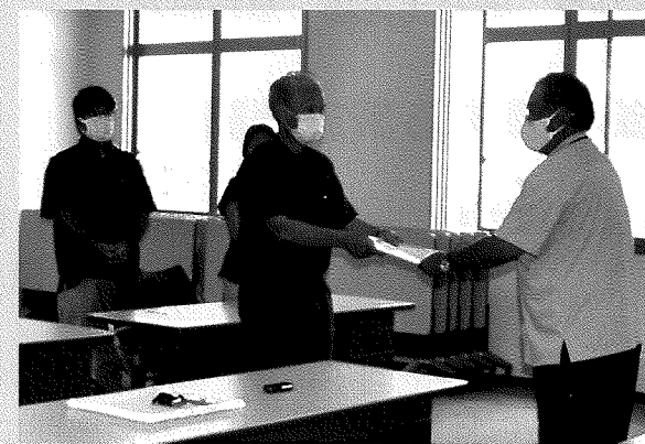
6月8日 沖縄防衛局に抗議

6月2日深夜、うるま市津堅島 の民有地へ米軍ヘリが緊急着陸 した事故を受け、日本共産党県 議団は8日、沖縄防衛局と外務 省沖縄事務所にて抗議を行いまし た。事故原因の徹底究明、すべ ての米軍機の飛行・訓練の禁止、 普天間基地の運用停止・閉鎖・ 撤去、在沖海兵隊の撤退、日米 地位協定の改定、特に「日米地 位協定の実施に伴う航空特例に 関する法律」を廃止し、日本の 航空法の順守、日米安保条約を 廃棄し、米軍基地を撤去し日本 の主権を取り戻すことを求めま した。