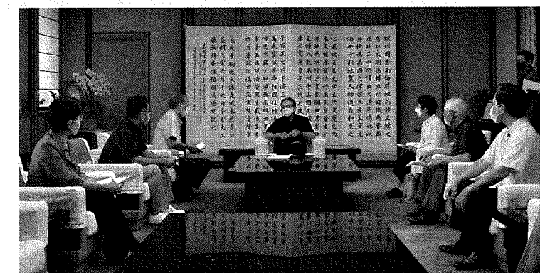
6月2日 玉城デニー知事への緊急要請