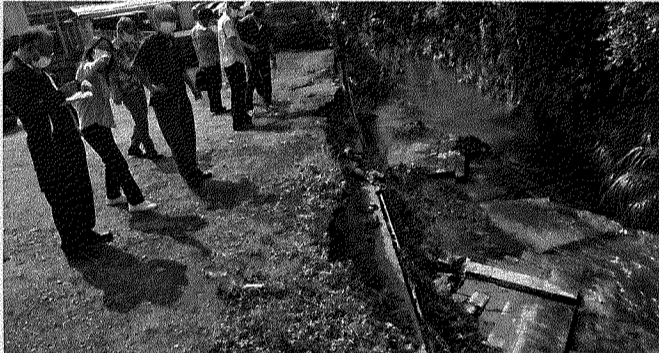
6月18日 真嘉比川の浸水被害調査と県交渉