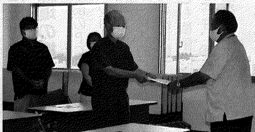
6月8日 津堅島米軍ヘリ不時着 防衛局抗議