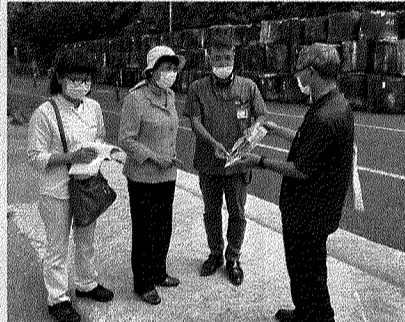
6月18日 県道38号線の災害調査 中部土木事務所長が対応