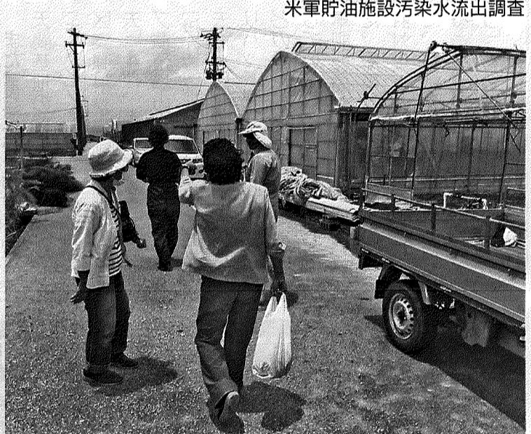
7月25日 ビニールハウス台風被害調査