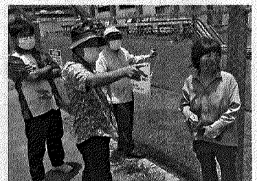
6月12日 うるま市米軍貯油施設汚染水流出調査