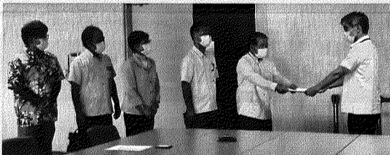
7月15日 渡名喜島沖米ヘリコンテナ落下 外務省抗議 同 防衛局抗議