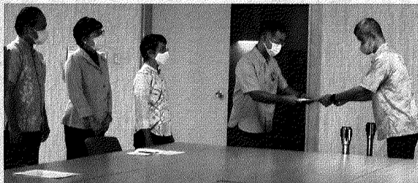
6月8日 津堅島米軍ヘリ不時着 外務省抗議