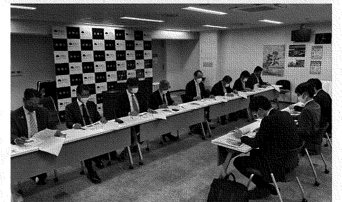
東日本大震災視察事前研修(復興庁)