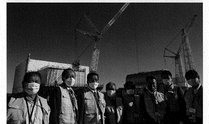
福島第一原子力発電所