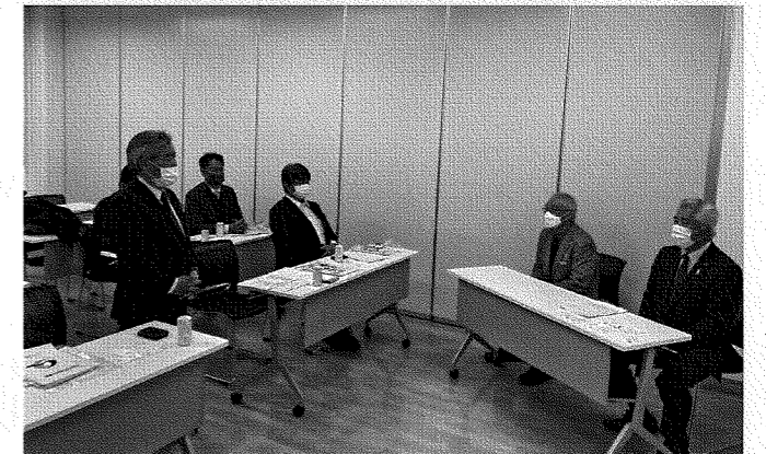
東京電力福島原発の被災状況を受ける