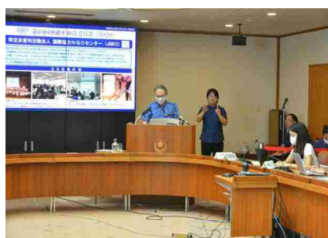
知事定例記者会見

知事が必要と認めるとき又は県政記者クラブから申し入れがあったときは、臨時記者会見を行います。臨時記者会見には、記者会見室を用いる場合と知事が移動時に記者からインタビューを受けるぶら下がり会見があります。