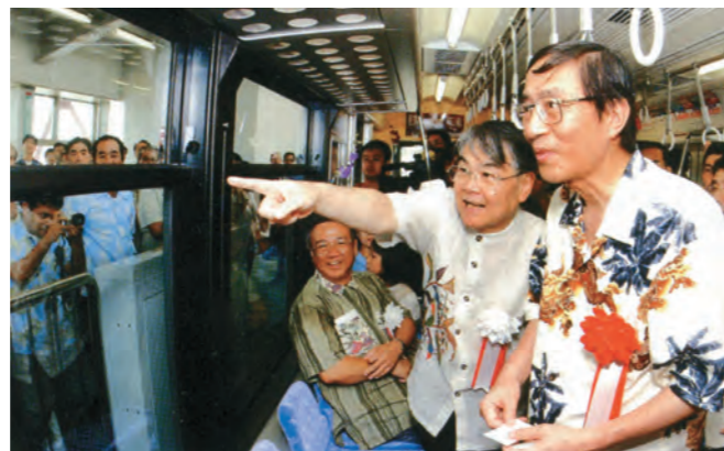
一番列車に乗車する稲嶺恵一知事や細田博之沖縄担当大臣