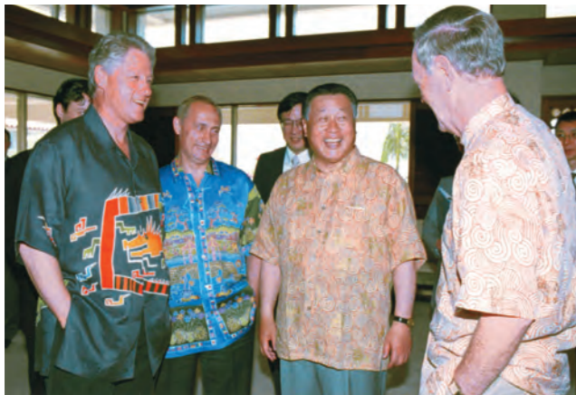
かりゆしウェアを着て懇談する各国首脳