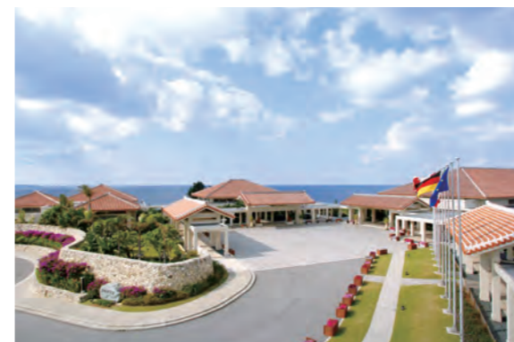
サミット会場となった 万国津梁館