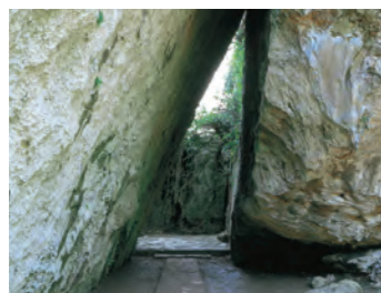
斎場御嶽（せいふあうたき）