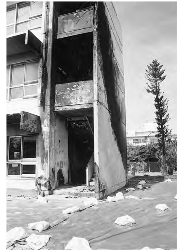
事故後約3週間経っても生々しさが残る墜落現場=9月1日撮影