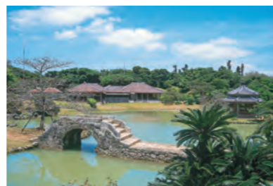
識名園（しきなえん）