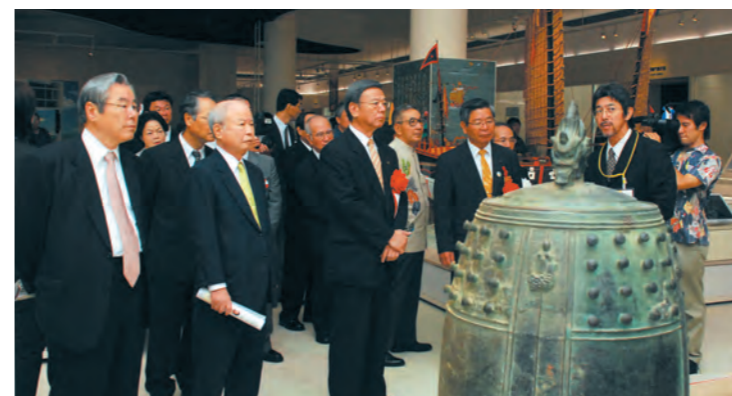
開館式典後の内覧会