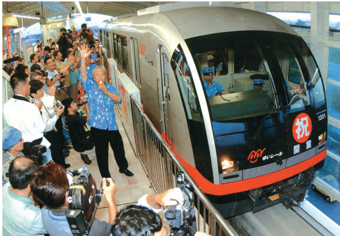
那覇空港駅で行われた一番列車の出発式