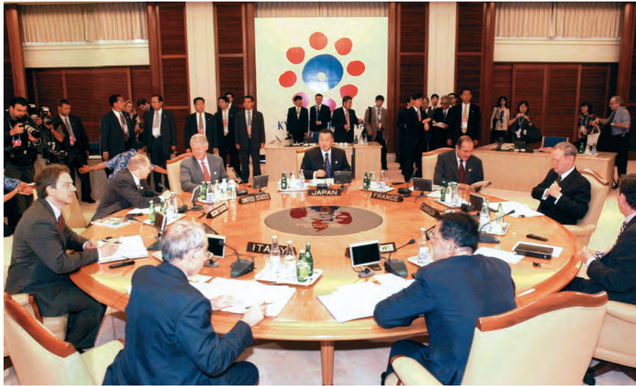
サミット最初のG8首脳会合