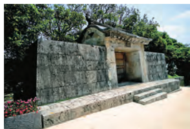
園比屋武御嶽石門（そのひゃんうたきいしもん）