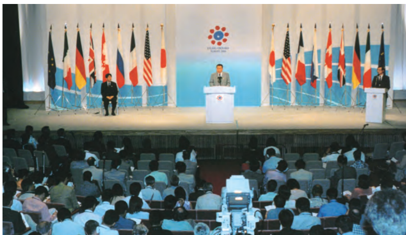
全日程を終えて「共同宣言」を 発表する森喜朗首相