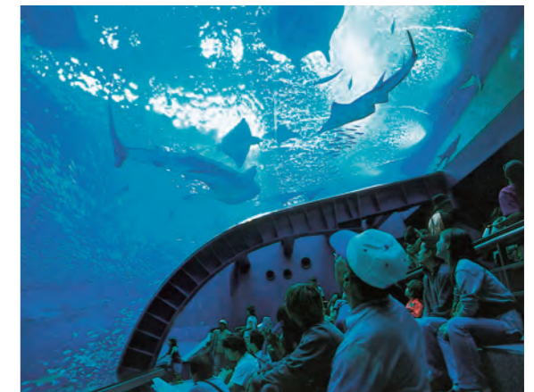
「アクアルーム」は見上げて観賞します。