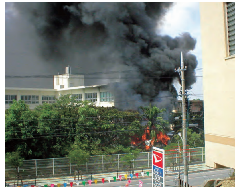
事故直後の様子。黒い煙が立ちこめています。