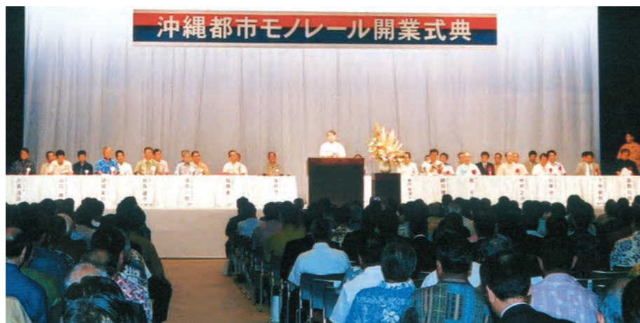
開通前日、県立武道館で開かれた開業式典