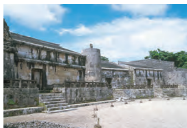
玉陵（たまぐすくどろん）