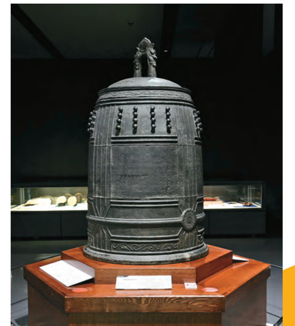
“万国津梁の鐘、と呼ばれる「旧首里城正殿鐘」