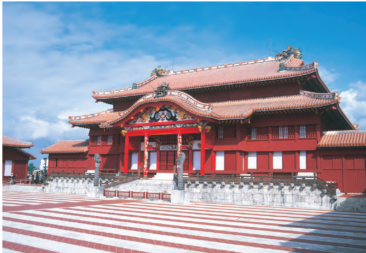
首里城跡（しゅりじょうあと）