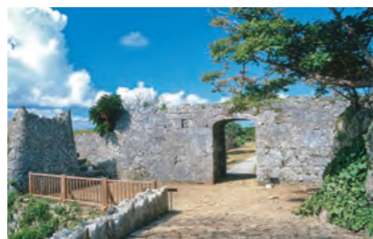
中城城跡（なかがすくじょうあと）