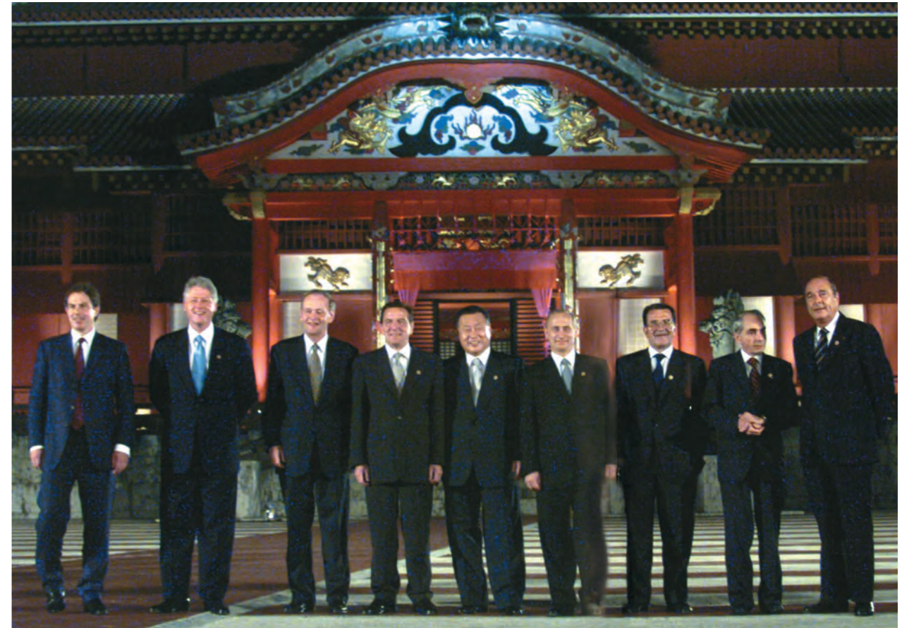
歓迎夕食会前に首里城をバックに記念撮影