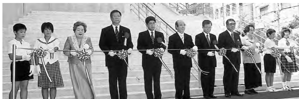
落成を祝うテープカット