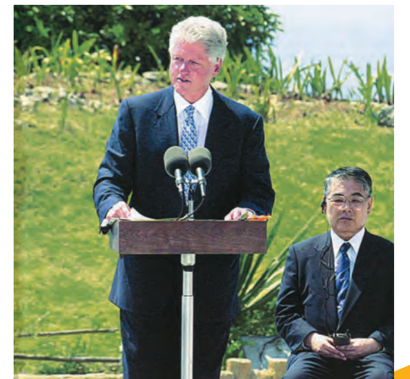
アメリカのクリントン大統領は21日、「平和の礎」を訪れて演説しました。