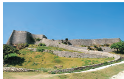
勝連城跡（かつれんじょうあと）