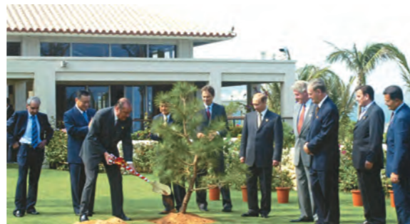
首脳会合前にはリュウキュウマツの記念植樹が行われました。