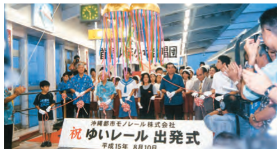
首里駅で開かれた出発式