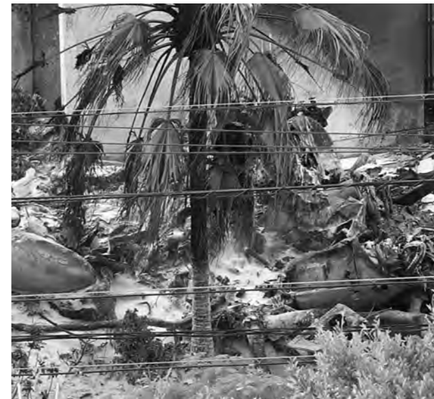
事故当日の墜落現場。ヘリの残骸が散らばっています。