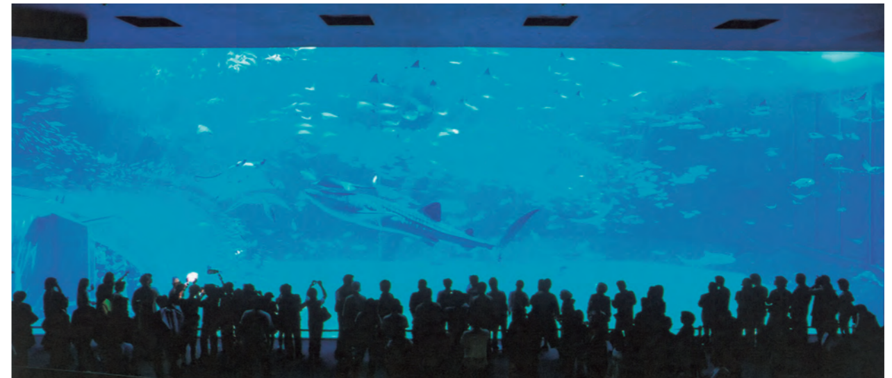
世界最大級の大水槽「黒潮の海」