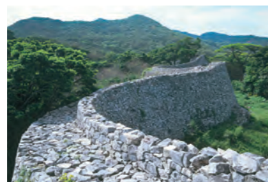
今帰仁城跡（なきじんじょうあと）