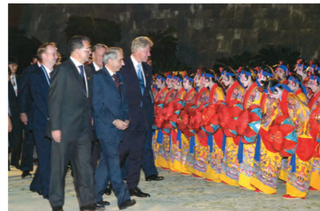
首里城で琉球舞踊を鑑賞後、演舞者たちの見送りを受ける各国首脳