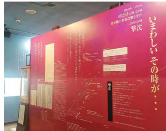
対馬丸の航路や米軍の記録を記したパネル