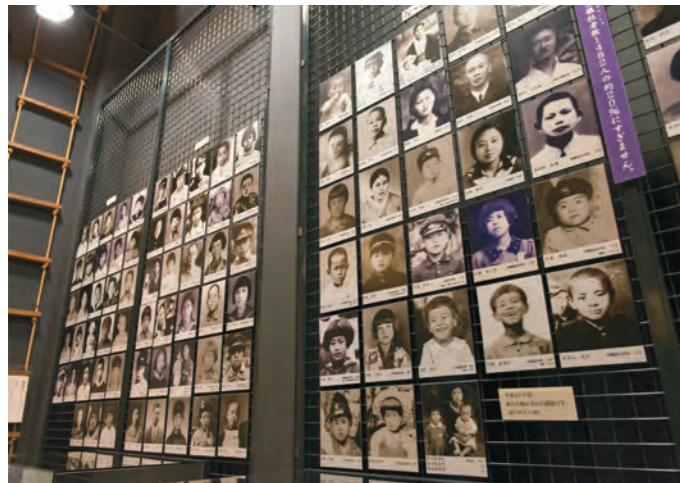
犠牲者の方々の顔写真が展示されています。