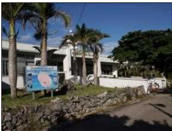
写真⑱ コミュニティセンター