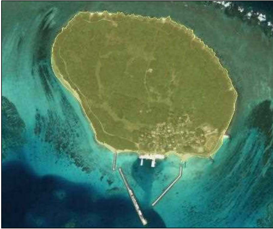
图 5-4. 土地利用規制地域(農業振興地域)