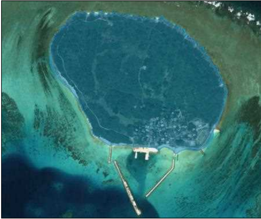
图 5-8. 土地利用規制地域(自然公園地域)