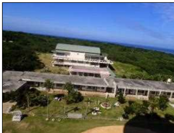
写真⑳ 鳩間小中学校