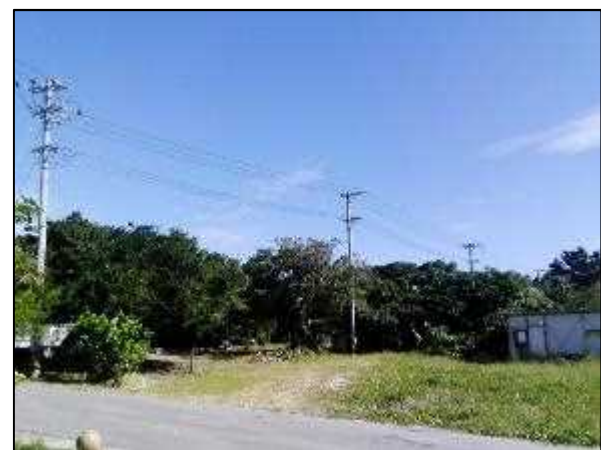
写真④ 高圧線ルート 3