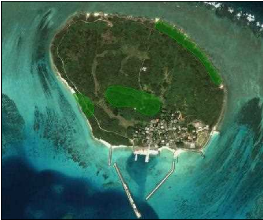
图 5-7. 土地利用規制地域(保安林)