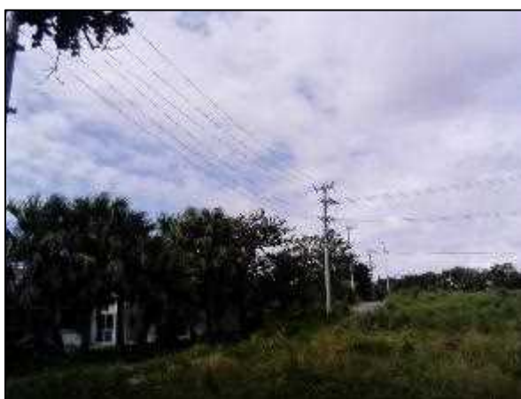
写真⑩ 高圧線分岐 3