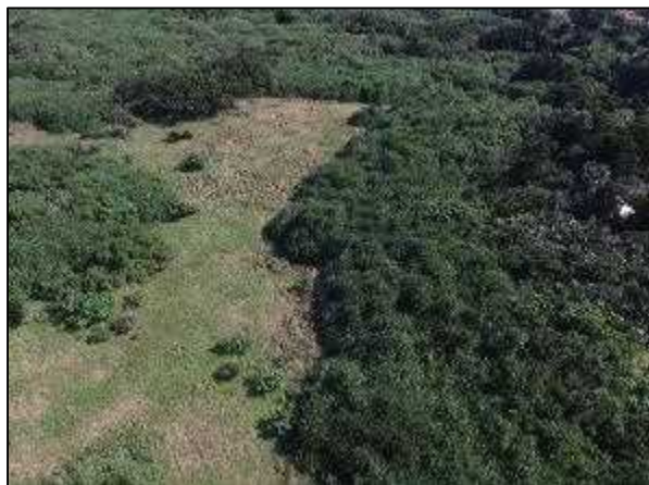
写真⑰ 町有地 1 (島中央東側の一部)