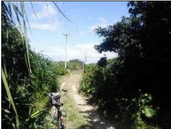
写真⑬ 高圧線ルート 8