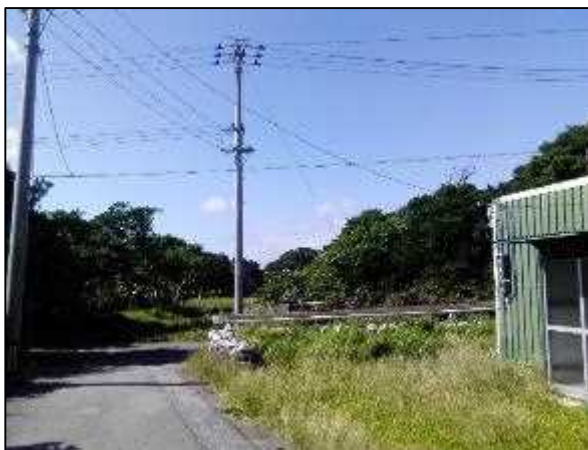
写真⑫ 高圧線ルート 7