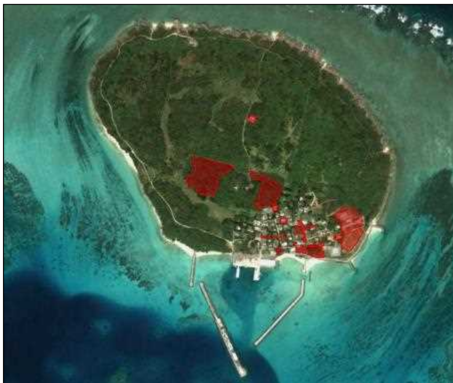
図 5-3. 町有地(鳩間島)

町有地である島の中央の灯台周辺は公園関係の第二種特別地域に指定されていることが確認された。