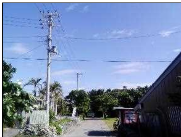
写真⑧ 高圧線分岐 2