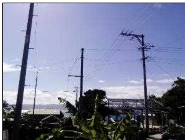
写真⑤ 高圧線分岐 1