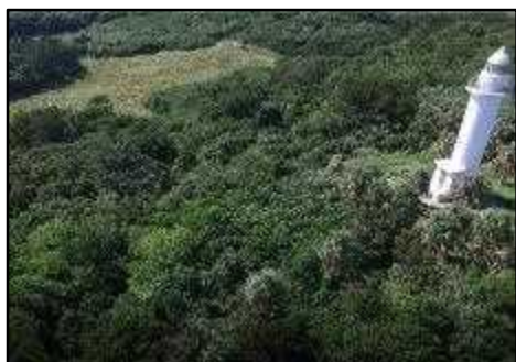
a. 島中央の町有地（西側）

島の中央にある町有地は東側には拝所があり、西側には灯台が存在する（写真⑰及び⑱参照）。