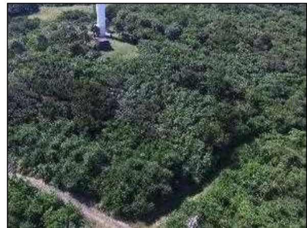
写真⑱ 町有地 2 (島中央西側の一部)