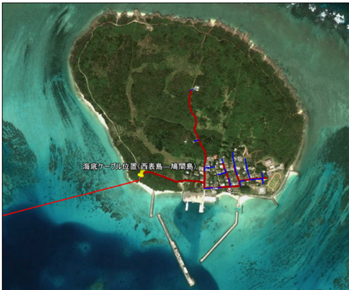
図 5-2. 送電ルート(鳩間島)