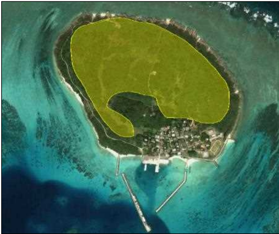
图 5-5. 土地利用規制地域((農用地区域)