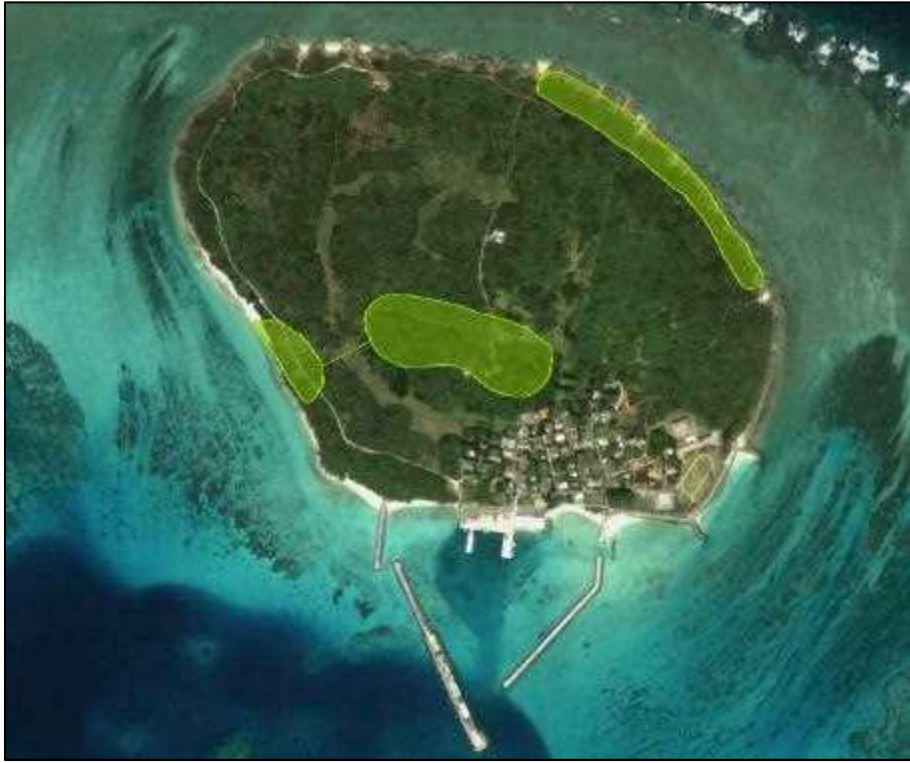
图 5-6. 土地利用規制地域(森林地域)