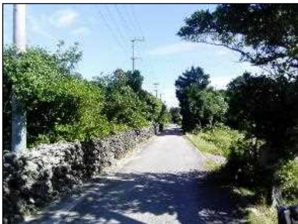
写真⑦ 高圧線ルート 5