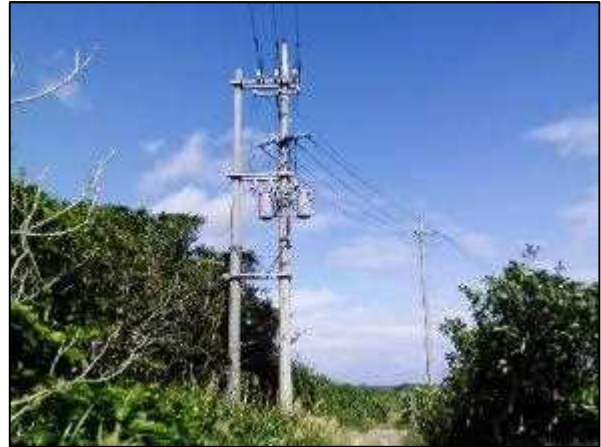
写真⑭ 高圧線ルート 9