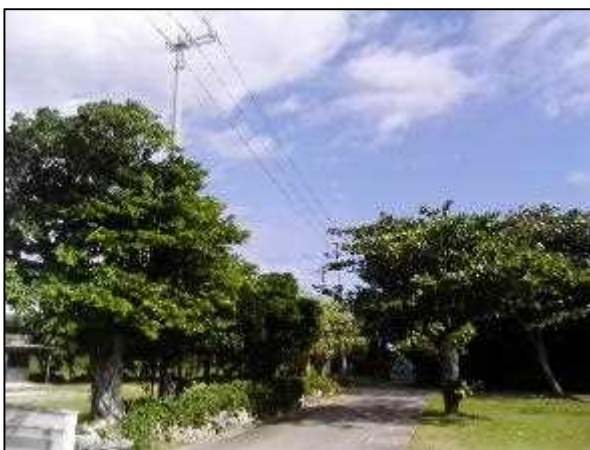
写真⑨ 高圧線ルート 6