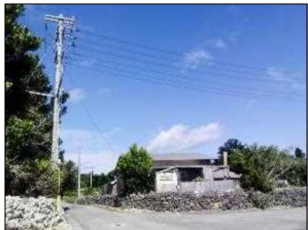
写真⑥ 高圧線ルート 4