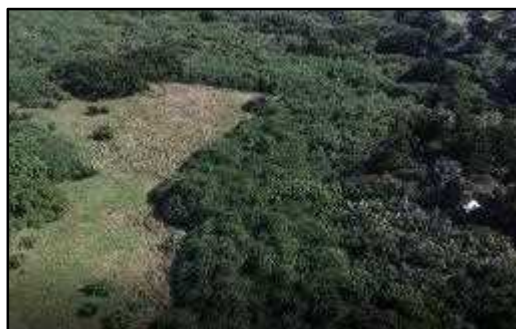
b. 島中央の町有地（東側）