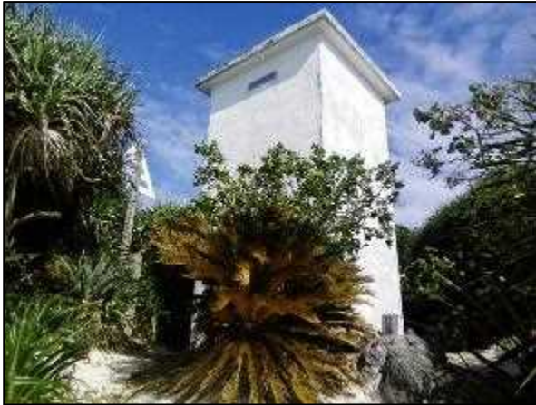
写真① 海底ケーブル立ち上がり