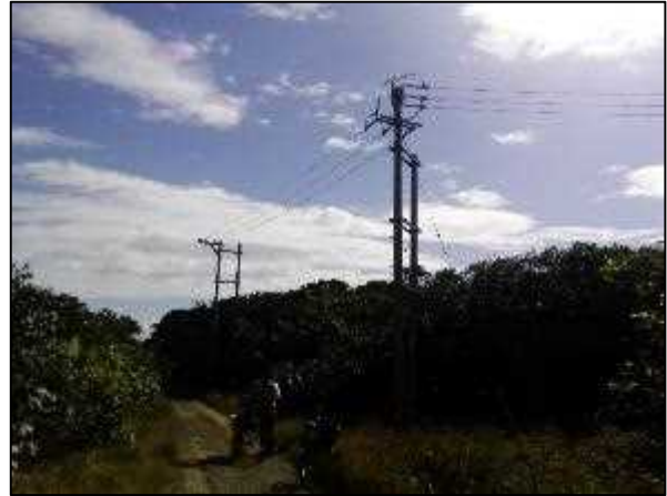
写真② 高圧線ルート 1