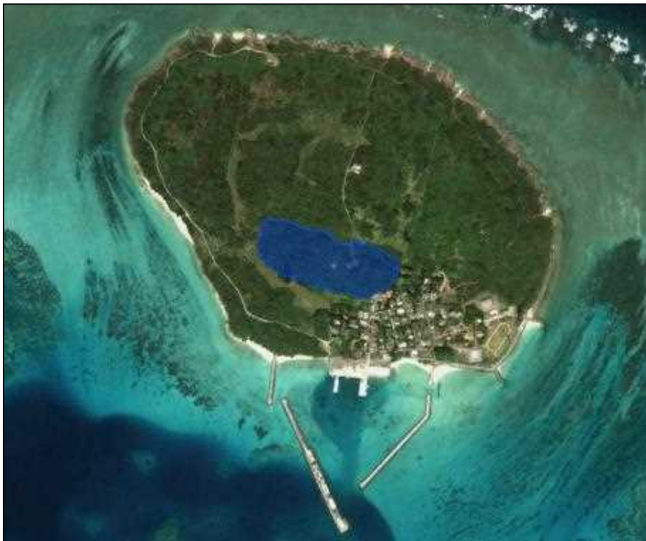
图 5-9. 土地利用規制地域(特別地域)