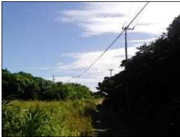
写真③ 高圧線ルート 2