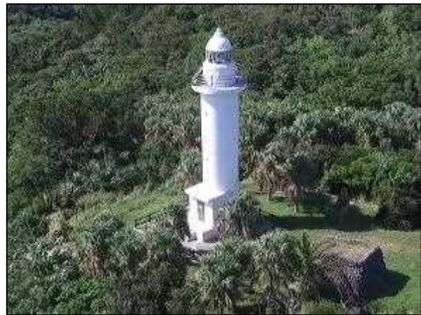
写真⑯ 灯台 (PV+LED 仕様)