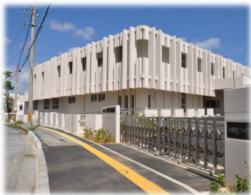
コザ児童相談所（沖縄市）

「営繕のあゆみ」も今回で38刊目となりました。 2022年版（令和4年版）は、令和4年度の完成建物（施設建築課の営繕事業）について全施設の工事概要一覧と写真による主な施設の紹介を収録しております。本誌に対するご意見、ご要望がありましたら当課まで連絡いただければ幸いです。また、施設建築課のホームページでも「令和4年度の工事実績」などと併せて、過年度の「営繕のあゆみ」を掲載しておりますので、ご案内致します。