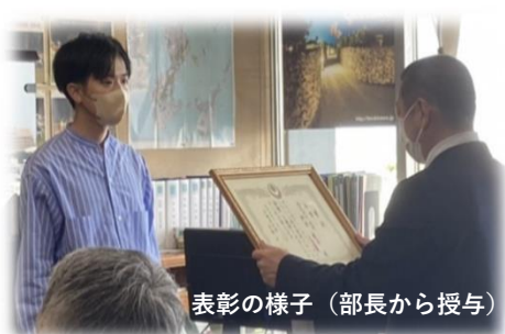
表彰の様子（部長から授与）

印象的でシンボリックな案であり、石積みを採用し、そこに植栽を這わせる計画とすることで、長い年月をかけて変容していき自然と調和していく様（さま）に沖縄らしさも感じられ、海軍壕公園の持つ歴史的な背景にも適したデザイン性が高く評価された。