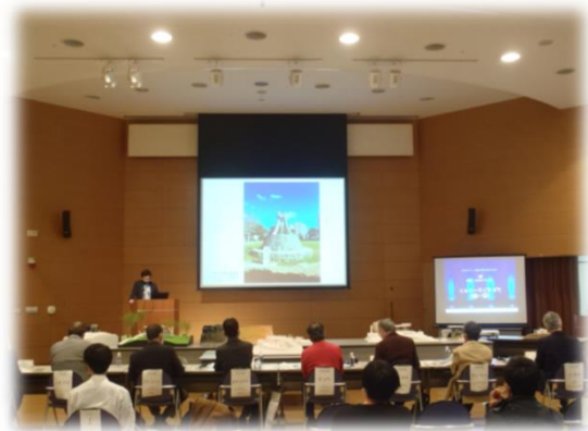
最終プレゼンの様子