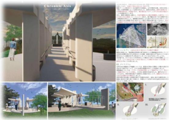
銅賞 Chronicle Axis～高台としての歴史を継承する展望台～