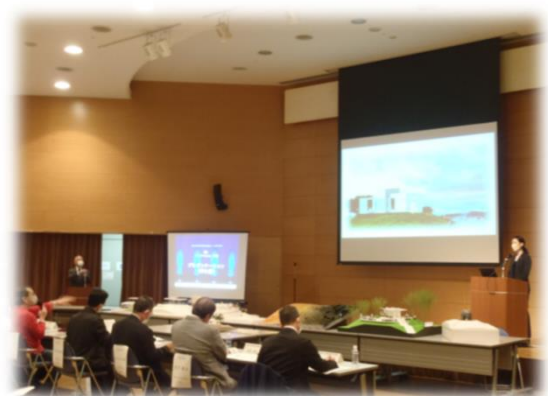
最終プレゼンの様子