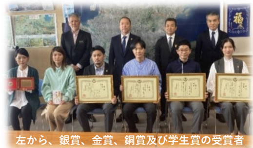
左から、銀賞、金賞、銅賞及び学生賞の受賞者