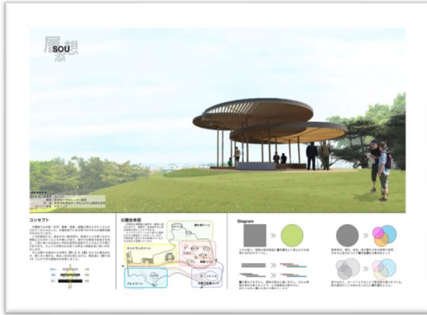
銀賞 SOU (そう)