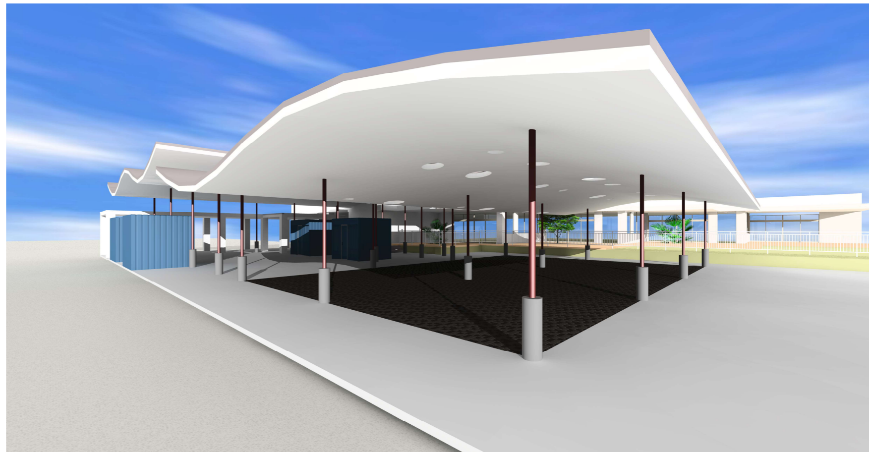
「大空に浮く波型の二枚の大屋根」が、待機スペース・荷捌きスペースを覆います。