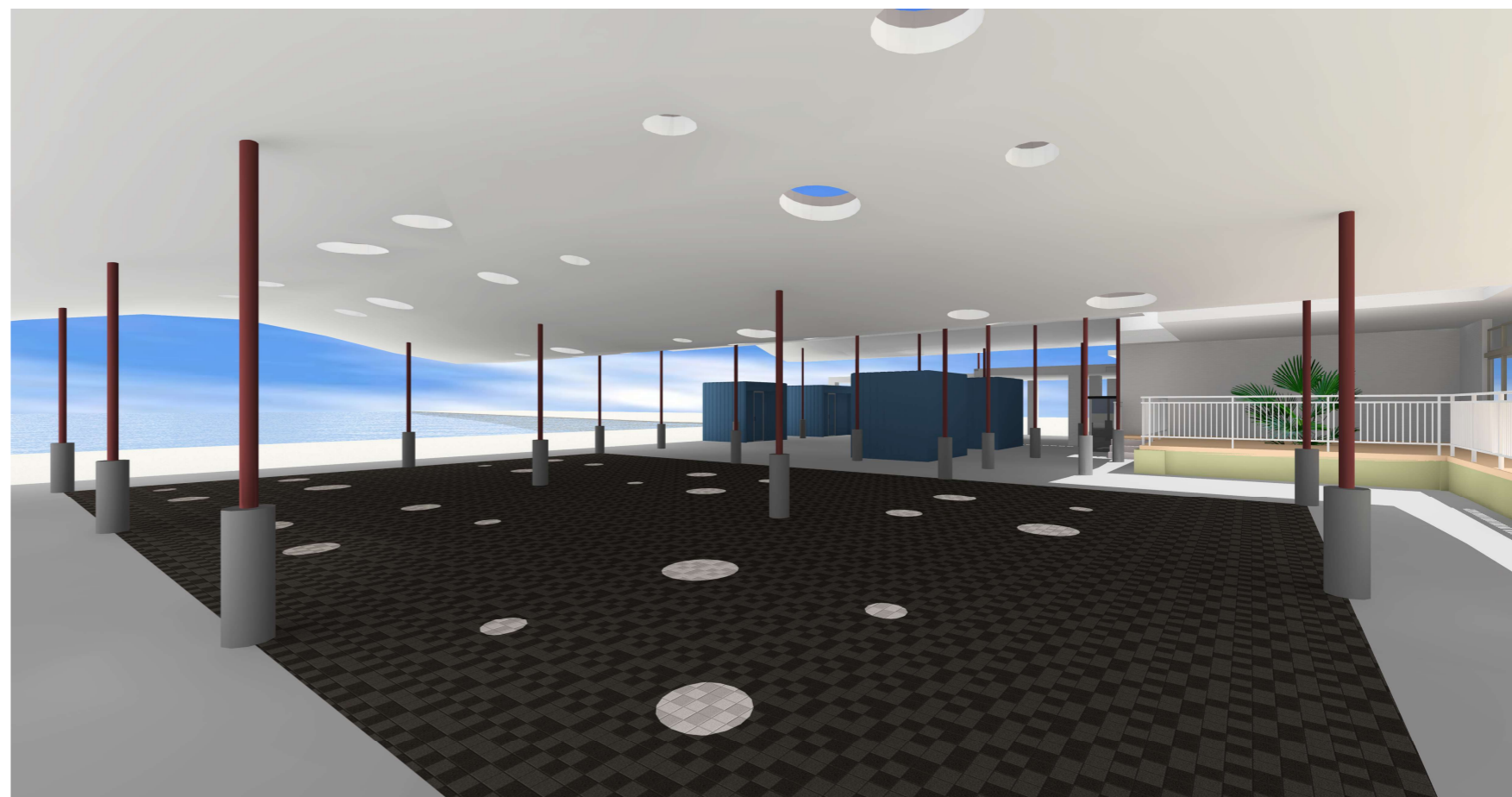
大屋根が覆う暗くなりがちな内部空間は、ポリカーボネート板のトップライトから、円形状の光が差し込みます。この球光は、海中の泡をイメージしています。