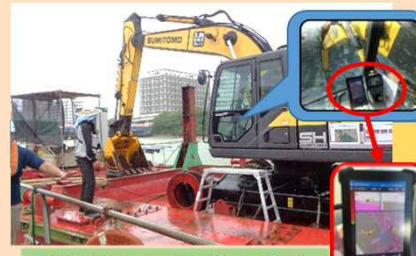
ICT建機モニターにて設計データ情報表示