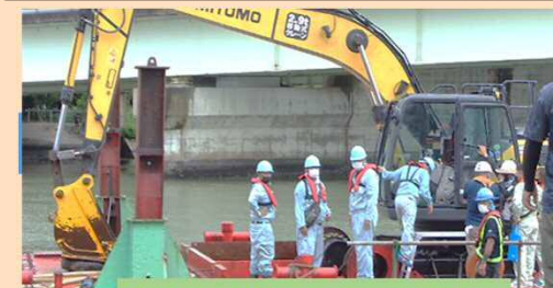
ICT建機を使用した施工デモの様子