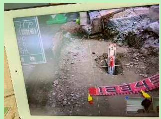
【スクリーンショットで現場状況を記録】