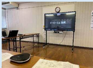
【大型モニター・マイクスピーカーの利用】