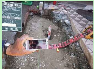
【使い慣れた機器を使用】