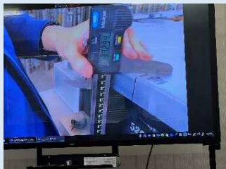
【寸法の数値化（デジタルノギス）】