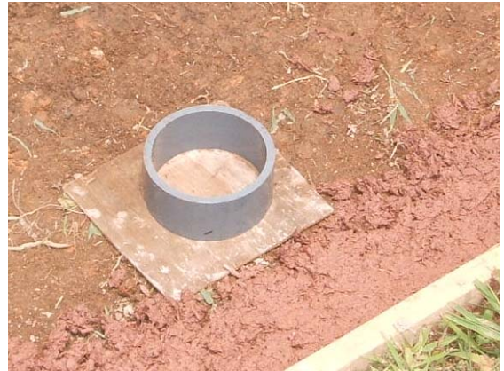
写真-1 供試体採取装置

施工直後の湿潤密度の目標値(g/cm 3 ) × 供試体載荷装置内部体積 (cm 3 )