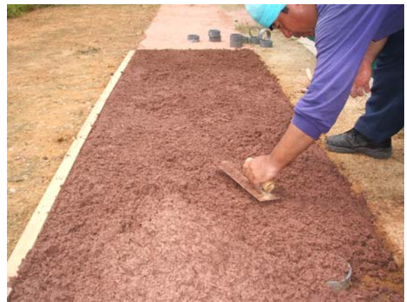
写真-2 敷き均しめ施工状況