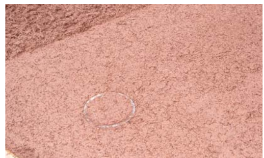
写真-4 締固め後の供試体