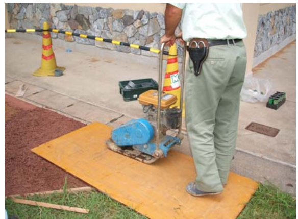
写真-3 締固め施工状況