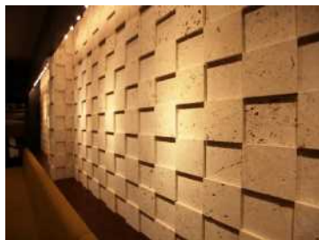
壁面に使用した例