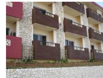
外部壁に使用した例