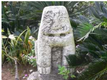
良い風合いが出たシーサーの例