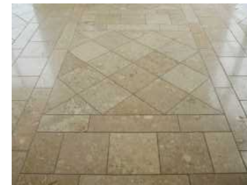
内部床に使用した例