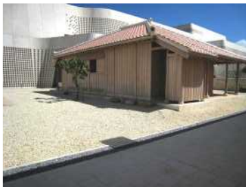
外部床に敷き詰められた例