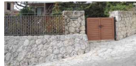
石造りを多く取入れた住宅街