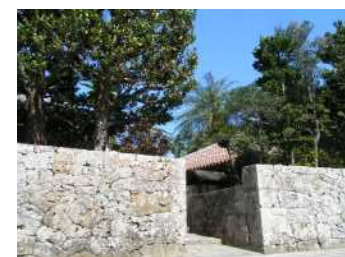
中村家住宅の石垣