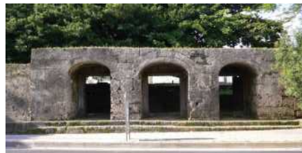
石門(那覇市 崇元寺石門)