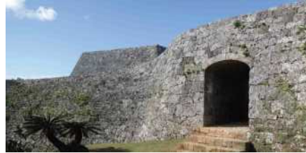
城門(中頭郡読谷村 座喜味城)

琉球石灰岩は、今から数万年以上前にサンゴや貝殻などが堆積してできた多孔質の堆積岩です。沖縄では古くから御獄やグスク、墓、石垣などで使用され、独自の石造文化を形成してきました。サンゴなどの化石模様が織りなす味わい深い肌合いと、象牙色の暖かい色合いが特徴です。