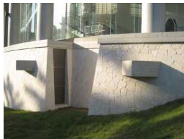
外部壁に使用した例