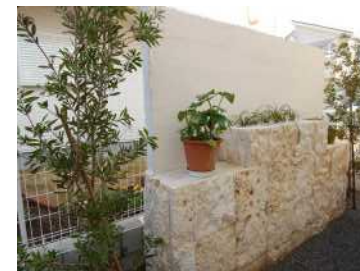
外部壁に使用した例