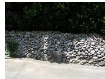
本部町山川集落の石垣