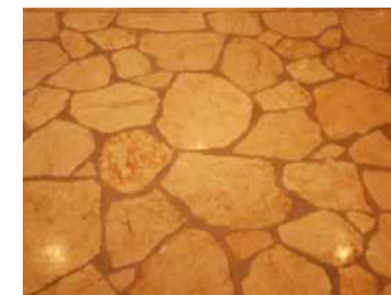
内部床に使用した例