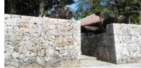
屋敷囲い(中頭郡北中城村 中村家住宅)