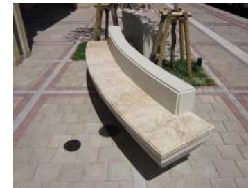
曲線的なベンチの例