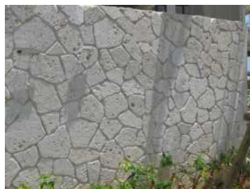
外部壁に使用した例