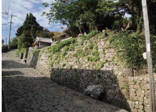
石畳と石積み の屋敷囲いが続く古い街並み(那覇市金城町)