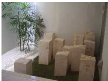
モニュメントの例