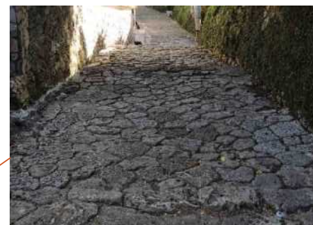
経年変化で風合いが出た石畳