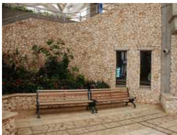
外部壁に使用した例