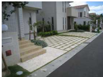
床舗装に使用した例