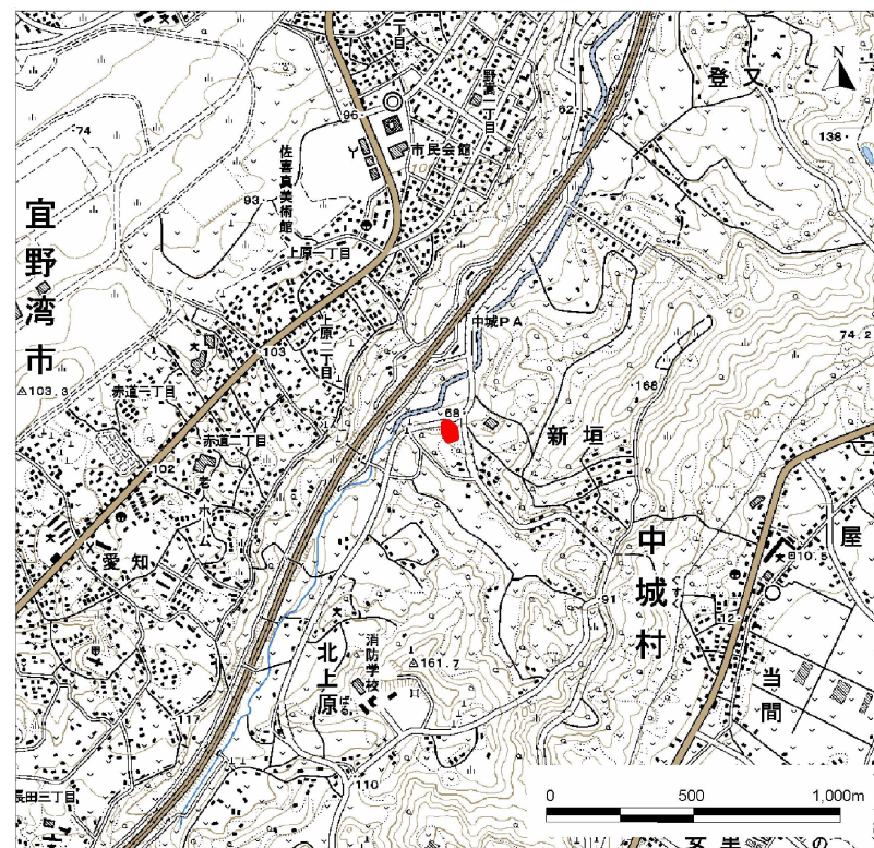
( 1/25,000 )