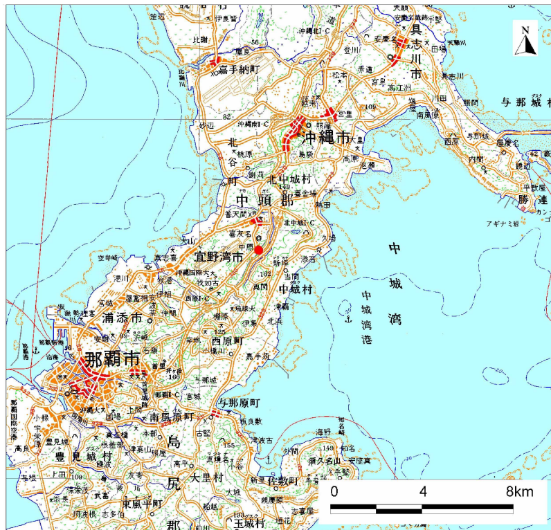
( 1/200,000 )