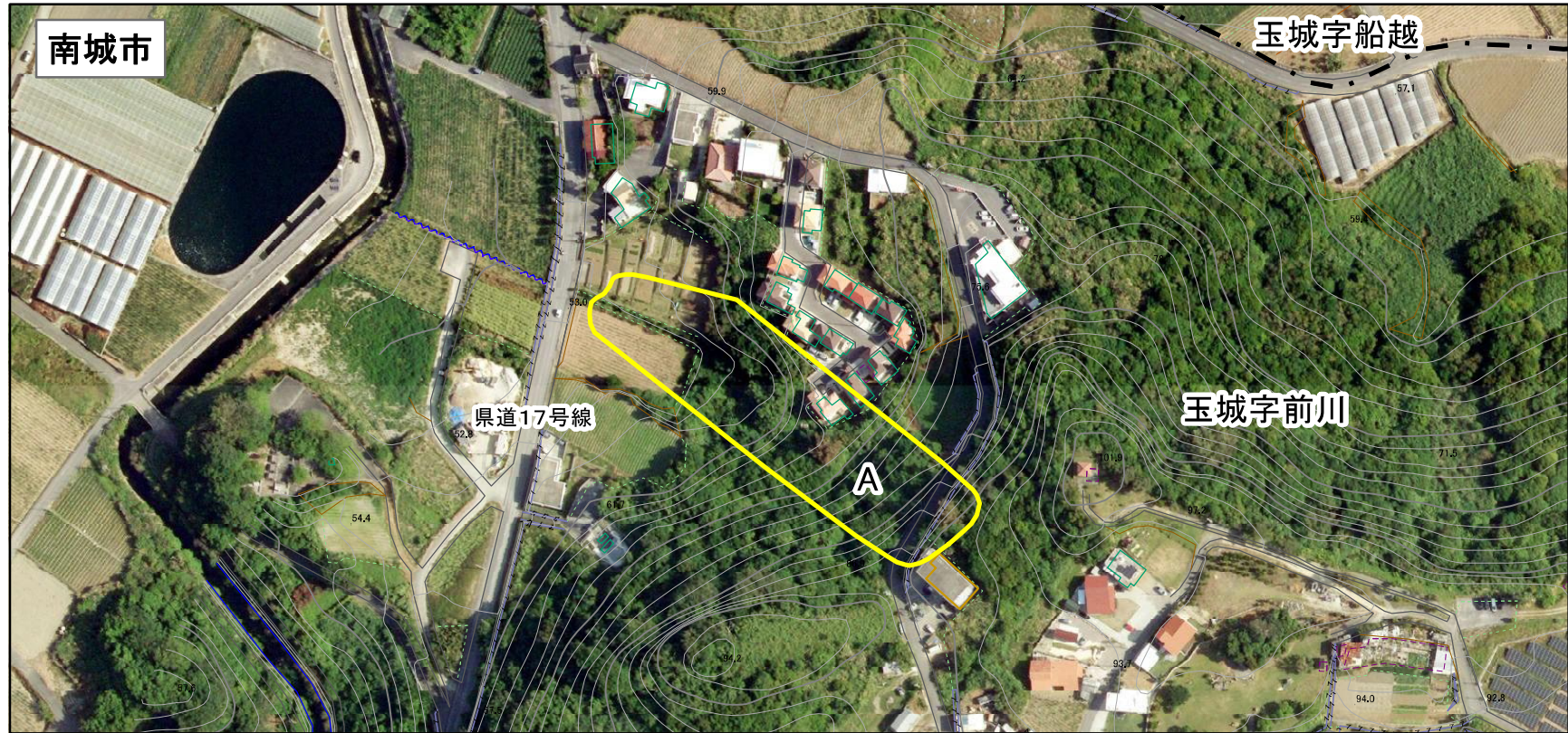
様式-2(地) 土砂災害警戒区域・土砂災害特別警戒区域 区域図