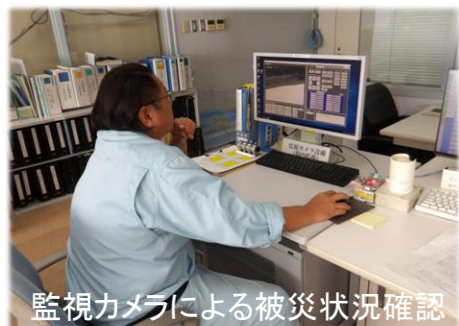
監視カメラによる被災状況確認