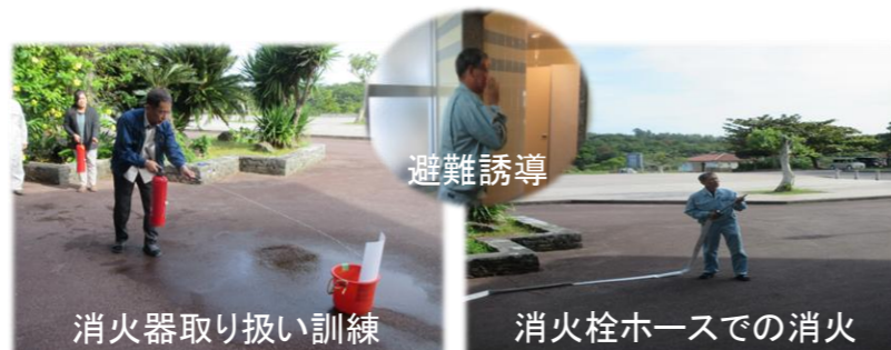
消火器取り扱い訓練

11月26日(水)に、倉敷ダム管理所の消防計画に基づいて、消防総合訓練が実施されました。これは、全職員に、防火・防災思想の普及を図るのが目的です。 また同日、地震災害対応訓練も実施されました。地震災害発生時の対応を相互確認し、取るべき行動、ダム管理所勤務者の初動、各点検の内容を理解し行動できるようになることを目的としています。