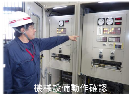
機械設備動作確認