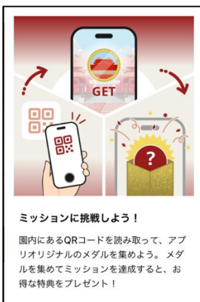
ミッションの遊び方

本アプリには、来園者の個人情報を取得することなく行動履歴を分析し、マーケティングに活用できる機能も備わっています。これにより、来園者との関係性を強化し、よりパーソナライズされた情報提供やサービス改善に繋げることが可能です。