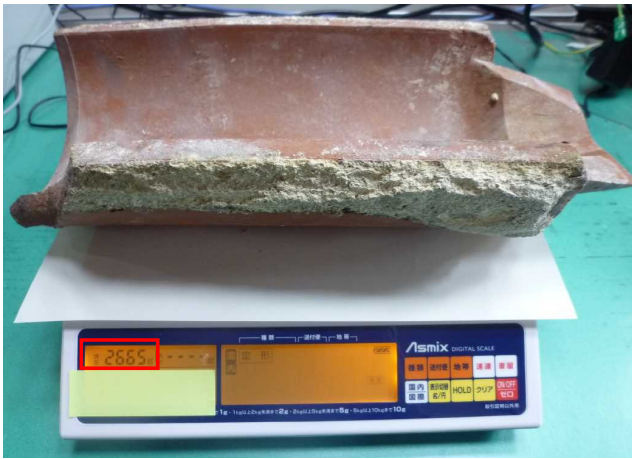
<例：破損瓦大（丸） 重さ約2,500g前後>