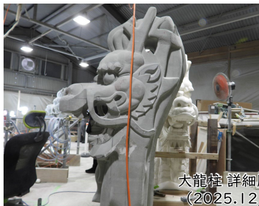
大龍柱 詳細彫り(阿形) (2025.12/25撮影)