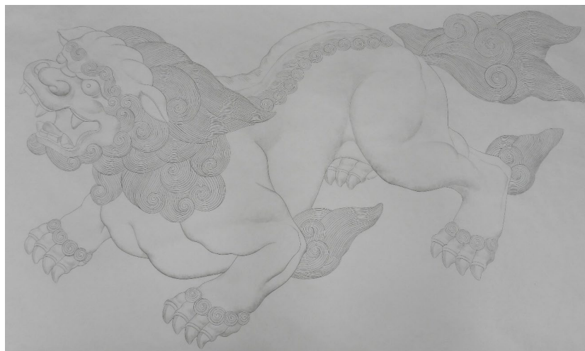
向拝奥の獅子 清書下図 (左:吽形、右:阿形) (2026.1/26撮影)