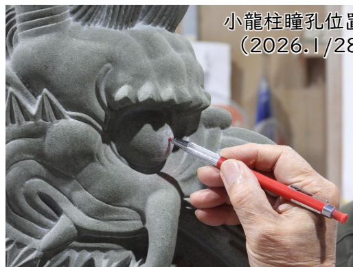
小龍柱瞳孔位置墨入れ (2026.1/28撮影)