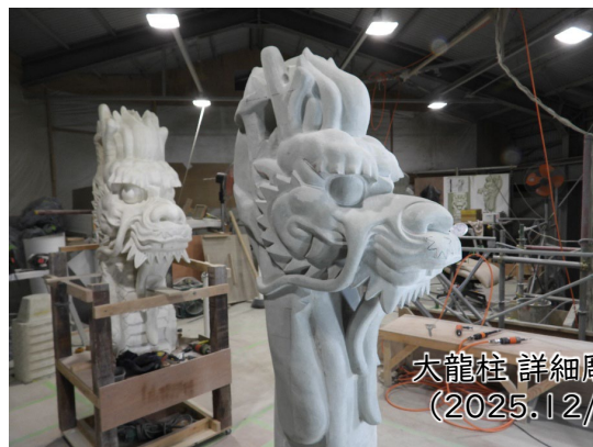
大龍柱 詳細彫り(吽形) (2025.12/25撮影)