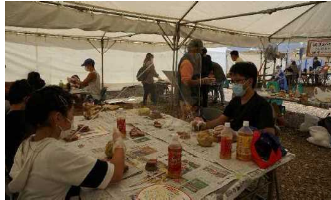
指導者：ぎやらりーゆしびん