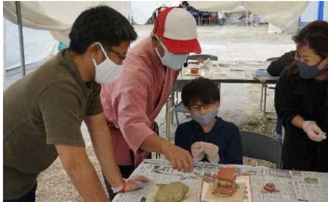
指導者：沖縄県琉球赤瓦漆喰施工共同組合