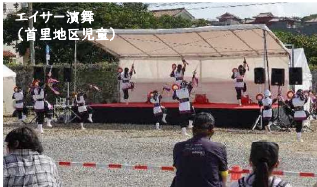
エイサー演舞 (首里地区児童)