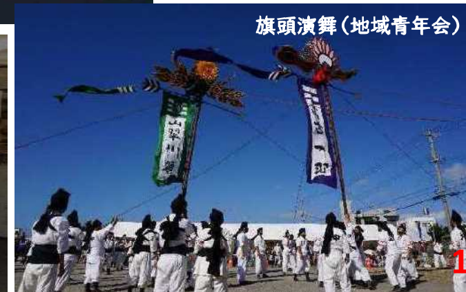
旗頭演舞(地域青年会)