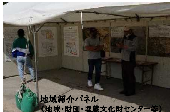
地域紹介パネル (地域・財団・埋蔵文化財センター等)