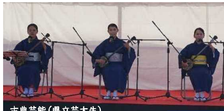
古典芸能(県立芸大生)