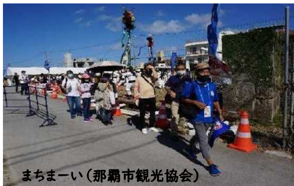
まちまーい(那覇市観光協会)