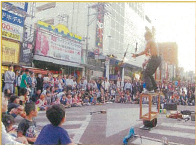
매주 일요일은 '트랜짓몰'로 명명하여 보행자천국으로서 개방됩니다.

관광상품점과 여러 음식점들이 즐비하여 편리한 관광거점입니다. 「팔레트 구모지」 앞 사거리에서부터 아사토삼거리까지의 1.6km에 이르는 거리입니다. 전후, 허허벌판에서 서민들의 손으로 부흥발전을 이뤄낸 사실로 인하여 기적의 1마일이라고 불리고 있습니다. 오늘날에는 기념품점을 비롯, 백화점과 호텔, 음식점 등이 즐비하여 밤늦게까지 성황을 이루고 있습니다.