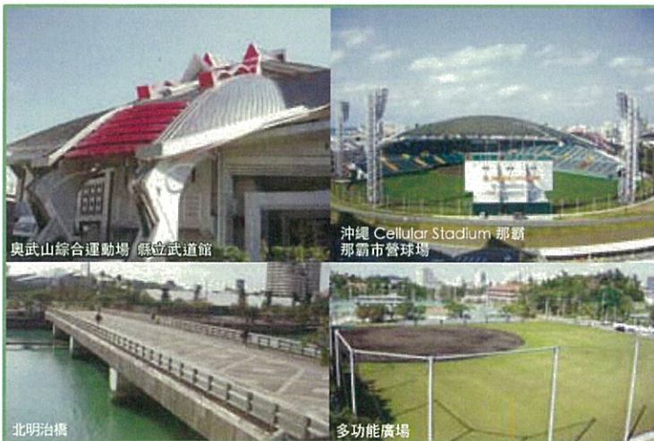
奧武山綜合運動場 縣立武道館