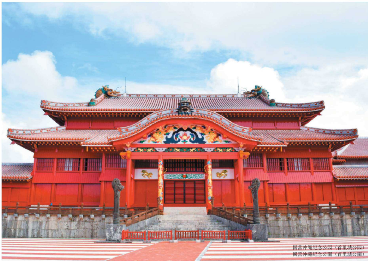
国营冲绳纪念公园（首里城公园） 国营冲绳纪念公园（首里城公园）