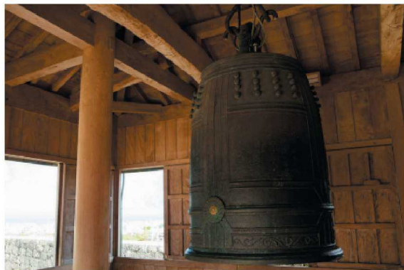
首里城正殿的鐘(萬國津梁的鐘:複製品)。“萬國津梁”指的是“连通世界的桥梁”。

首里城正殿之鐘(萬國津梁之鐘:複製品)。所謂「萬國津梁」就是「世界橋梁」的意思。