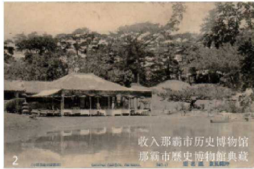
收入那霸市歷史博物館典藏 那霸市歷史博物館典藏

系，将外交及贸易范围扩展到了日本、朝鲜及其他东南亚国家（现在的泰国、马来西亚、印度尼西亚、越南等）。作为海外交流事业指挥塔的首里城曾留下一句名言：“我们琉球要通过船只，成为连接亚洲的桥梁。”