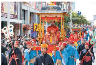
琉球王朝繪卷行列(首里城祭)

居重要位置的正殿前廣場—「御庭」，一整年裡各式活動都在這片廣場上舉行，特別值得一提的是，中國皇帝派遣使節團到琉球，當時歡迎這些使節團的藝能表演，