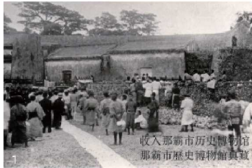
收入那霸市歷史博物館典藏 那霸市歷史博物館典藏