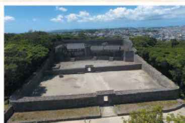
2018年12月,成为首个入选国宝的冲绳县建筑物 2018年12月首座被指定為國寶的冲繩縣內建築