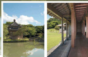
中国风的六角堂(左侧照片)。在御殿可以将整座庭院尽收眼底(右侧照片)