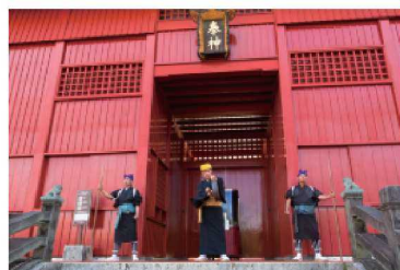
据称创建于尚清王时代（1530年）的守礼门（上方照片）。奉神门每天早上开门时，都会举行“御开门”（下方照片）