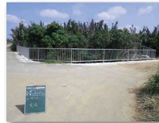
農業水利施設保全合理化事業による改修後のフェンス