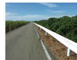
水利用調整・高度化支援事業による改修前の法面保護