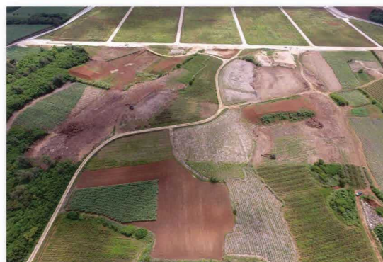
区画整理前のほ場②