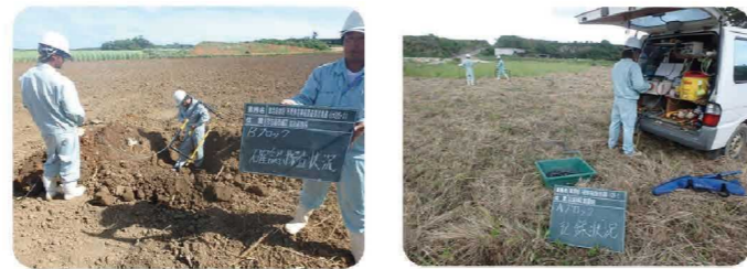
不発弾探査の様子