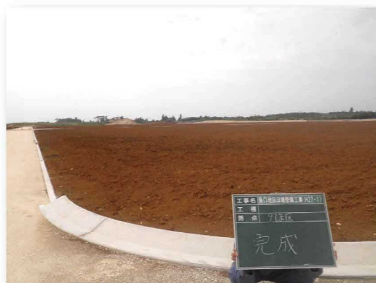
区画整理後のほ場①