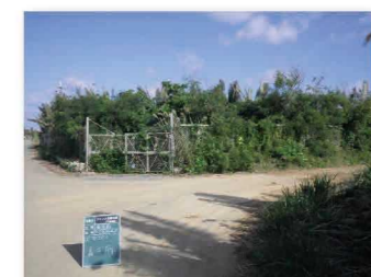
農業水利施設保全合理化事業による改修前のフェンス