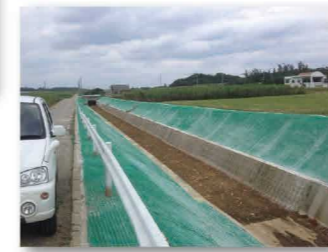
水利用調整・高度化支援事業による改修後の法面保護