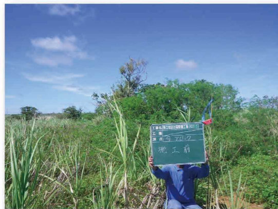
区画整理前のほ場①