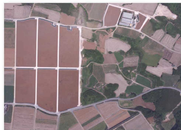
区画整理による整備箇所と未整備箇所の比較