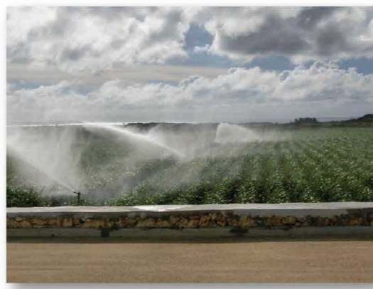
畑かん施設整備後(スプリンクラー)