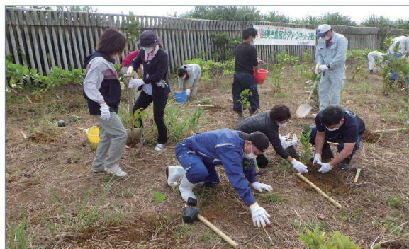
美ざ島宮古グリーンネット(防風林の植栽、育林活動)