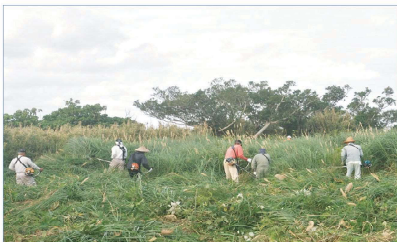
比嘉自治会(土地改良施設周辺の御嶽及び拝所の清掃活動)