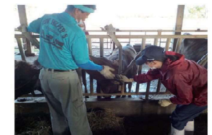
アカバネ病予防注射