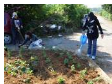
景観形成(花苗植栽)