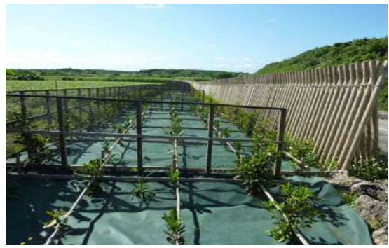
農地保全整備事業 (防風施設)