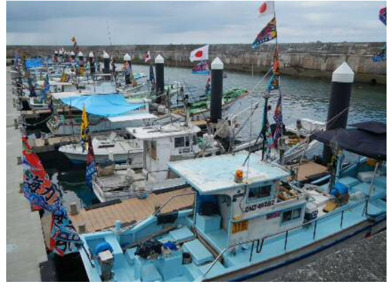
浮棧橋(佐良浜漁港)