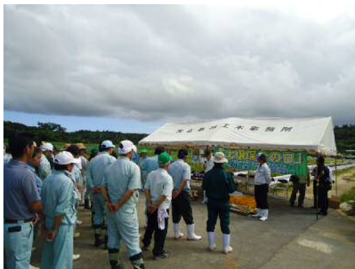
土壌保全の日 開会式の様子

毎年6月の第1水曜日を土壌保全の日とし、土壌の流出による地力の低下を未然に防ぐことを目的に、土壌保全の必要性について意識の改善と啓発を目的として1990年から施行されました。宮古地域では、グリーンベルトの植栽活動を通して、土壌流出防止と農地の景観形成を目指し、リュウノヒゲやアキノワスレグサ等の植栽活動を行っています。