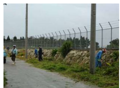
農道・防風林帯等の維持・管理作業