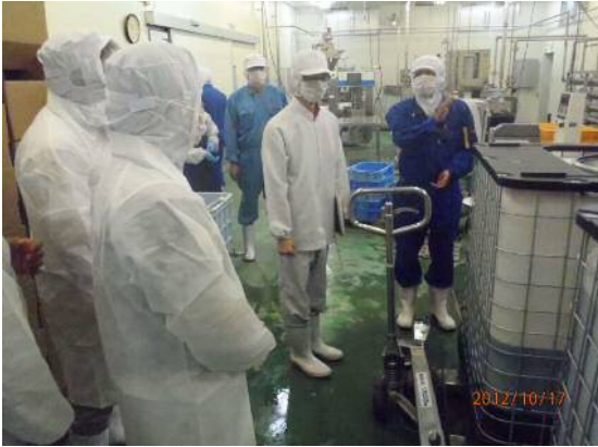
モズク加工・流通視察