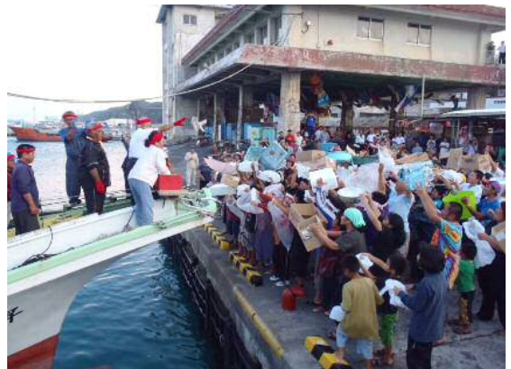
カツオフォーラムで行われた「おおばんまい」