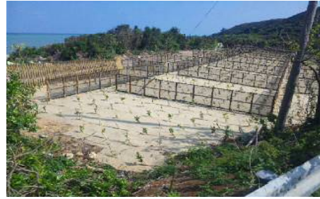
海岸防災林造成事業②