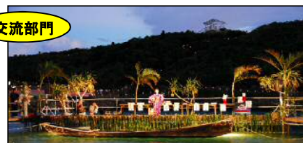
友利なりやまあやぐまつり実行委員会