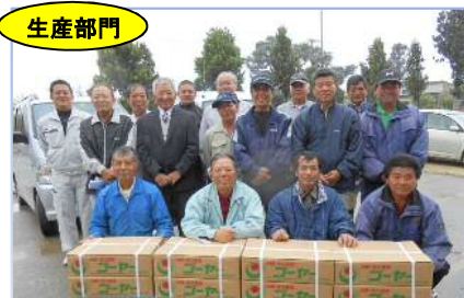
JAおきなわ宮古地区野菜・果樹生産出荷連絡協議会ゴーヤー専門部会