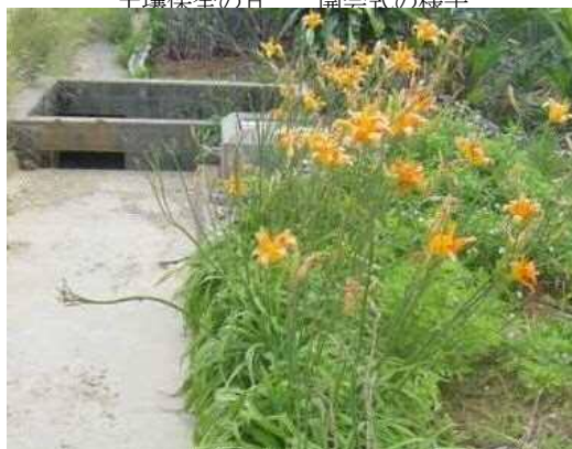
アキノワスレグサ