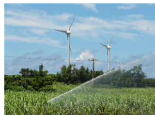
畑かん施設整備後（スプリンクラー）