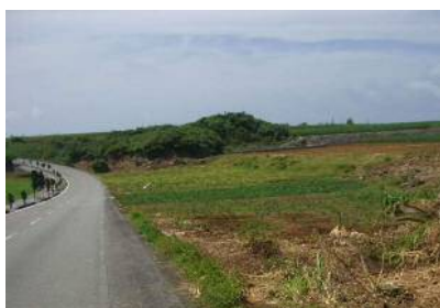
区画整理前のほ場