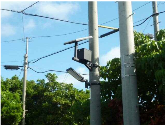
防災施設整備ソーラー照明(西東・吉田・仲原・久松)