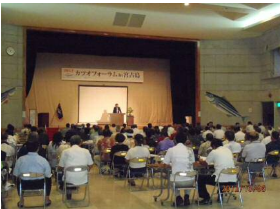
カツオフォーラム

カツオフォーラムin宮古島(日本カツオ学会、宮古島市、伊良部漁協共催)が平成24年10月6日(土)伊良部島で開催された。カツオフォーラムは日本各地のカツオ漁業が盛んな市町村が毎年持ち回りで開催し、今年で3回目となる。県内外からのカツオ漁業関係者の他、島内の一般参加者も目立ち、伊良部島での開催に島民の大きな関心が寄せられた。フォーラム後、佐良浜漁港で3隻のカツオ船による「まんがゆーいが一す(釣獲一万尾を祝う菓子)」と「おおばんまい(大盤振る舞い)」が行われ、お菓子やカツオの切身を集めようとする島人で賑わった。カツオばんざい交流会も開催され、夜遅くまで各県のカツオ関係者の交流が深められた。