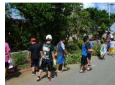
景観形成(空缶拾い)