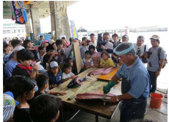
パヤオの日マグロ解体ショー