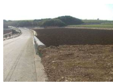
区画整理後のほ場