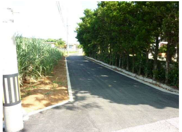
農業集落道整備 (吉田)