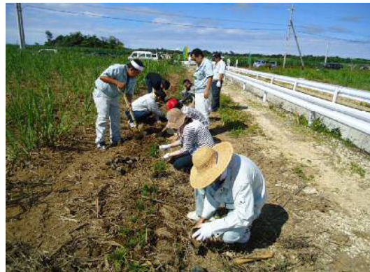
土壌保全の日 リュウノヒゲの植栽活動