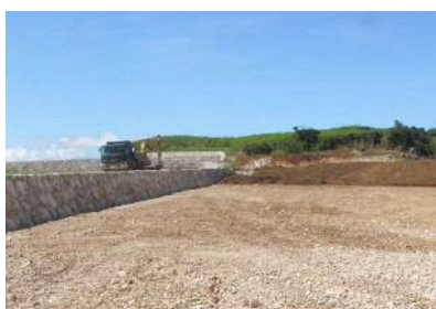
区画整理工事の様子