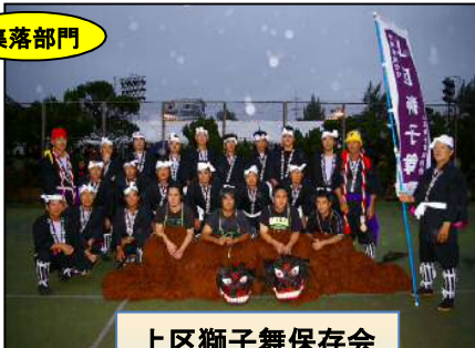
上区獅子舞保存会