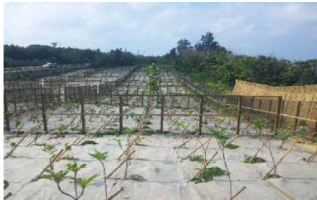
海岸防災林造成事業①