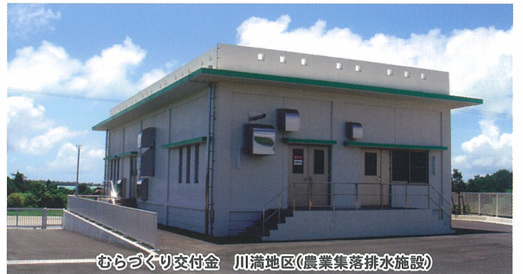
むらづくり交付金 川満地区(農業集落排水施設)