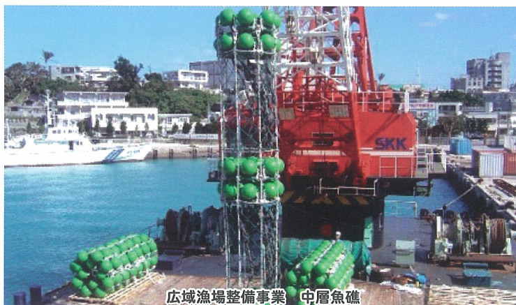
広域漁場整備事業 中層魚礁