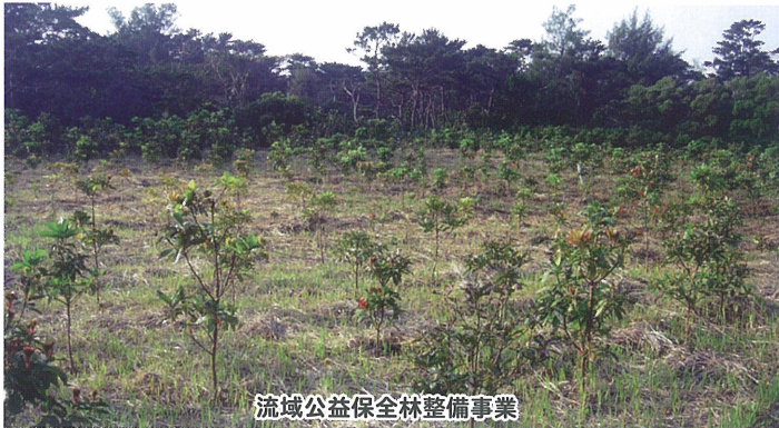
流域公益保全林整備事業