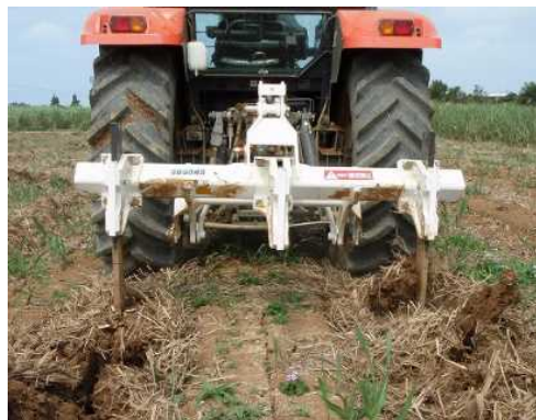
↑ 心土破碎機 (サブソイラ、プラソイラ、 ハーフソイラなど)