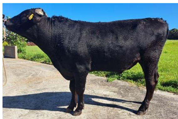
美茂北 美百合×茂北福×安福久