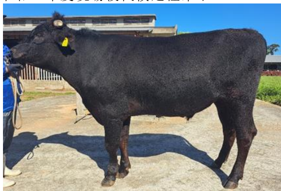
美津桜鵬 美津照重×美国桜×白鵬85の3