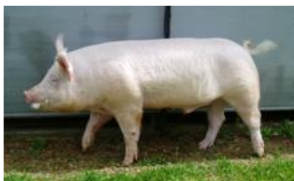
大ヨークシャー種