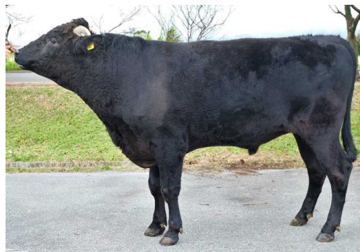
さきてるしげ 幸紀照重：幸紀雄×美津照重×安福久 産地：竹富町 直接検定DG：1.08