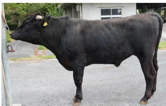
しげふき 茂福輝：茂北福×百合白清2×福之国 産地：今帰仁村 直接検定DG：1.05