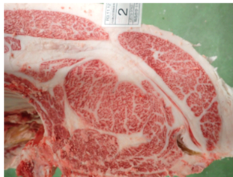
照百合守×美国桜×安福久 雌 31.3ヶ月齢 枝肉重量：512.5kg BMS No.12 ロース芯面積：77cm 2 一価不飽和脂肪酸 (MUFA) 含有率：59.8%