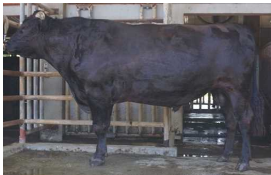
てるゆりもり 照百合守：美津照重×百合茂×勝忠平 産地：宜野湾市 後代検定平均BMS No：8.41