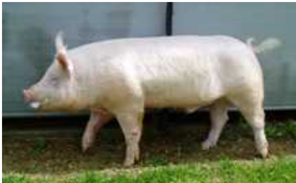
大ヨークシャー種