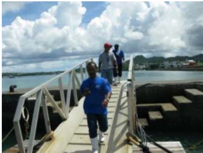
海面生簀に向かいます。 当センターの人気No.1スポットです。