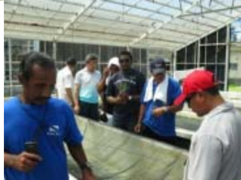
ヒメジャコの稚貝や親貝の水槽を熱心に観察。