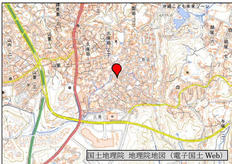
国土地理院 地理院地図 (電子国土 Web)