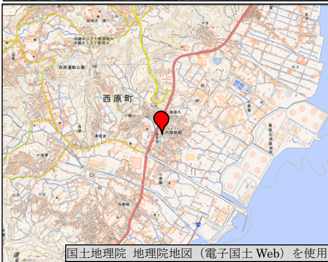
国土地理院 地理院地図 (電子国土 Web) を使用