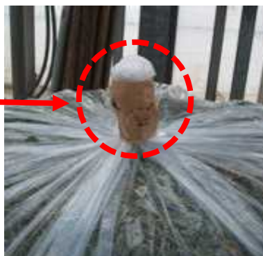
ビニール袋の口をしっかり閉める