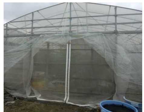
ファスナー付きカーテン