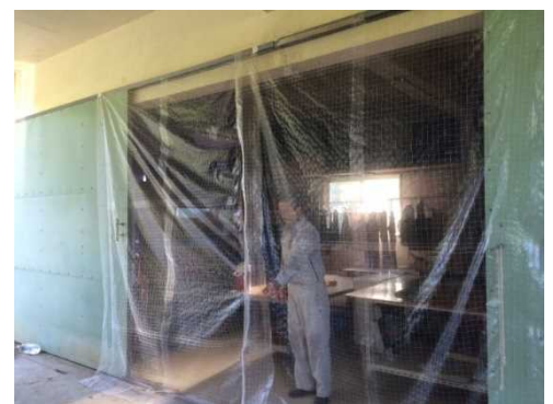
集荷場入口のネット設置