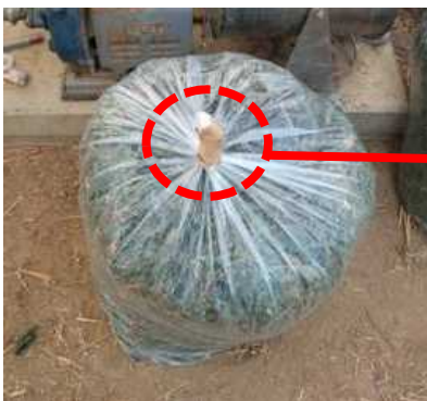
果実残渣等をビニール袋に入れて処分