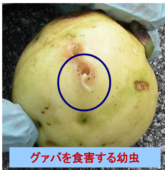
グアバを食害する幼虫