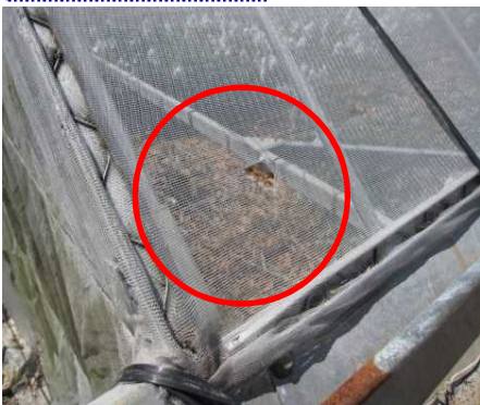
ネット等の破れの補修