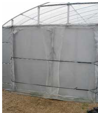
二重カーテン+留め具