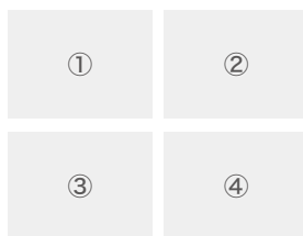
表 - 表紙：ヤブガラシ類の特徴