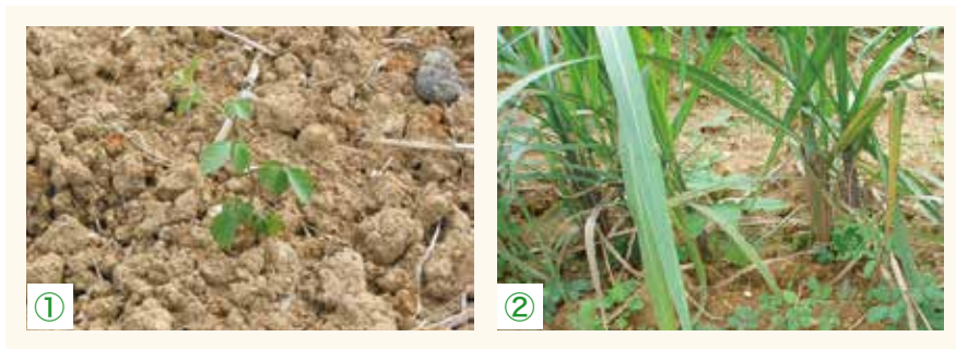
①、②ヤブガラシ類の発生初期