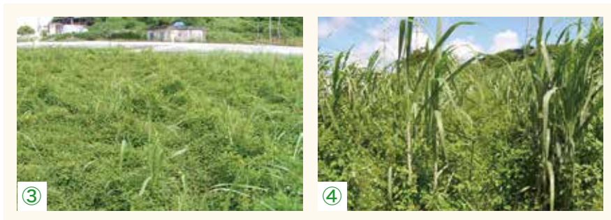
③、④ヤブガラシ類が繁茂したさとうきびほ場