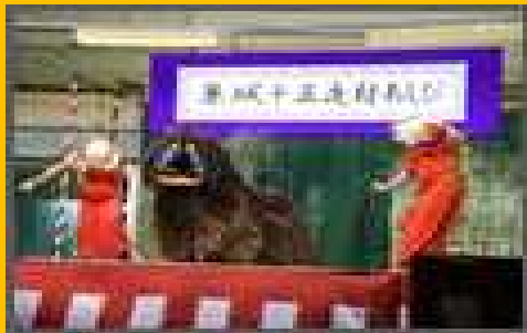
【集落部門】久米島町兼城自治会「兼城獅子舞」 十五夜に舞う獅子舞でふるさとづくり