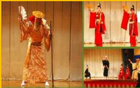
【集落部門】宜野座村漢那区「豊年祭」 100年続く伝統行事 産業共進会のふるさとづくり