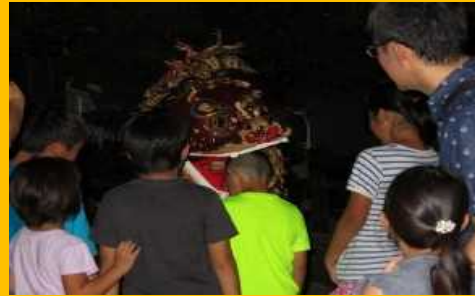
【集落部門】南風原町神里区自治会「シーサーケーラシー」 伝統文化で集落を守り、結いの心を育むふるさとづくり