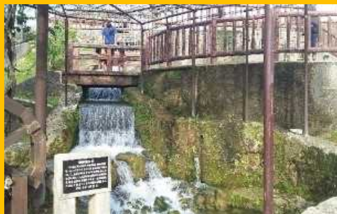
【集落部門】糸満市与座区自治会「与座ガー」 伝統文化の継承と世代交流や住民団結によるふるさとづくり