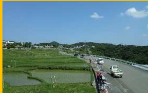
【集落部門】久米島町仲地自治会「棚田の水田」 棚田景観を活用したふるさとづくり