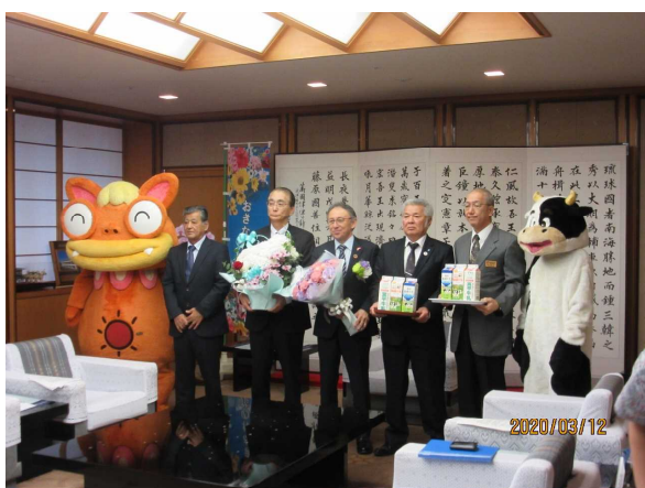
県産花きの知事贈呈