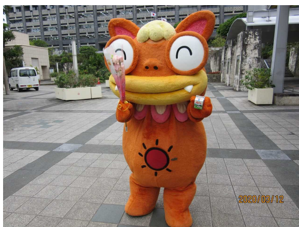
ホワイトデーに向けた県産トルコギキョウの 無料配布 (場所：県民広場)