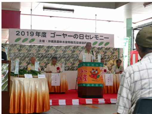
○ゴーヤーの日セレモニー