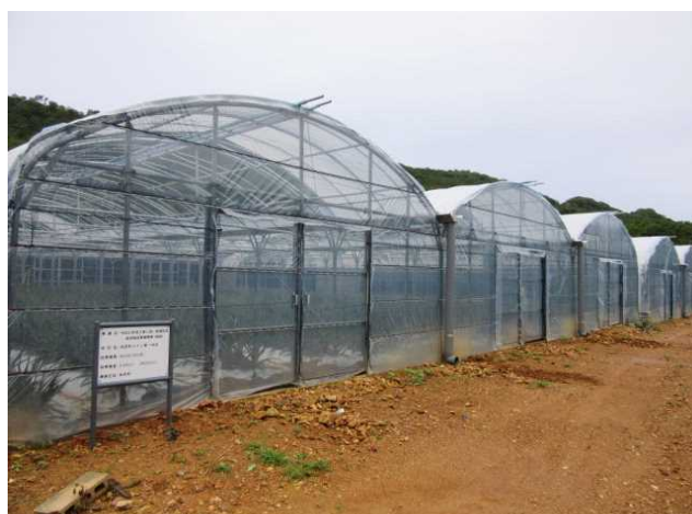
強化型耐候性施設(強化型パイプハウス) (令和元年度災害に強い高機能型栽培施設の導入推進事業)