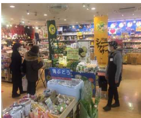
○沖縄シークワサープロモーション