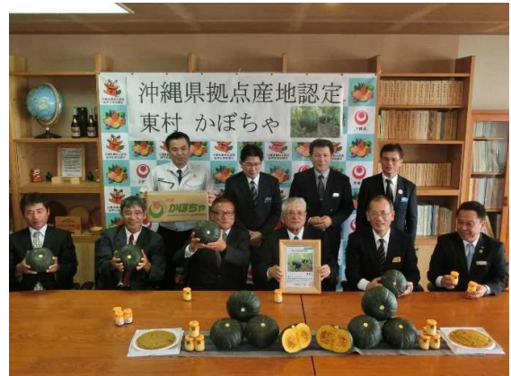
東村:かぼちゃ 平成31年3月27日認定