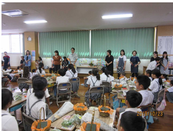
小中学校フラワーアレンジメント教室の 開催