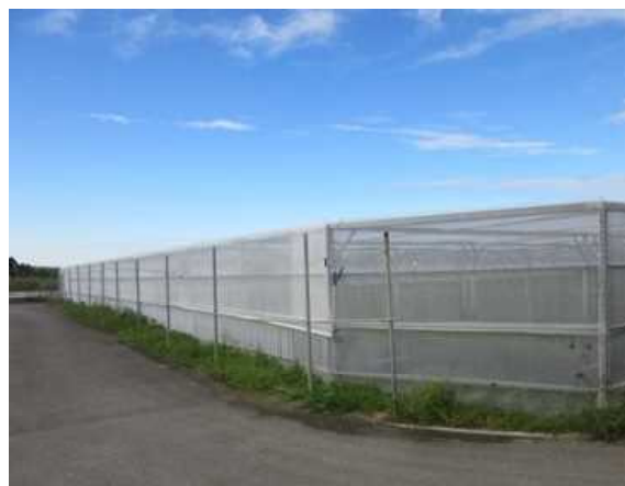
気象災害対応型平張施設の導入 (災害に強い高機能型栽培栽培施設の導入推進事業)