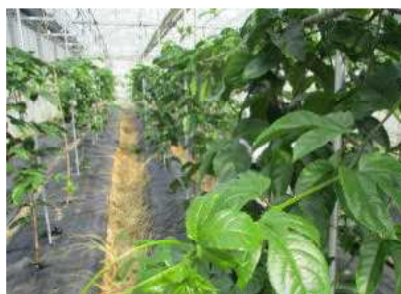
パッションフルーツ健全種苗供給システムの実証 (令和元年度熱帯果樹優良種苗普及システム構築事業)