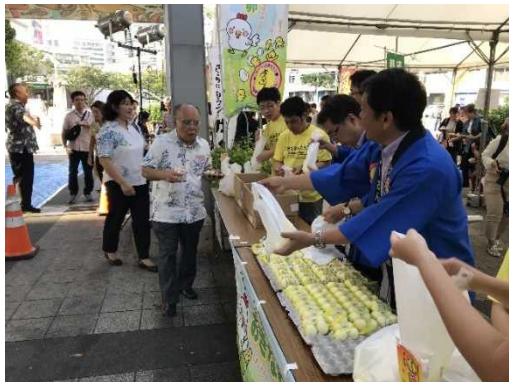
○「うちな〜いい肉の日」キャンペーン