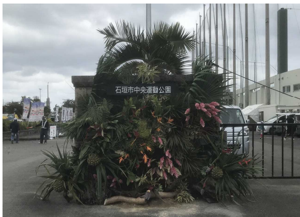
プロスポーツチームキャンプでの 県産花きフラワーアレンジメント展示 (石垣市)