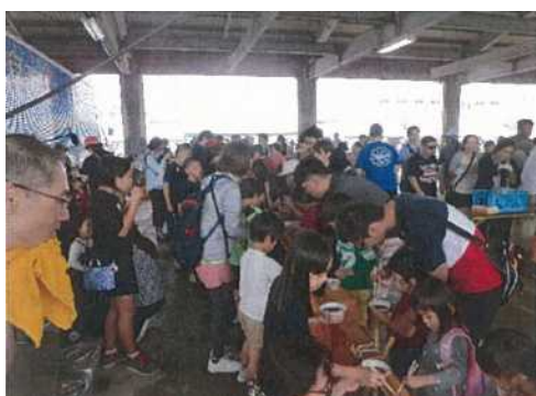
○第17回「もずくの日」イベント