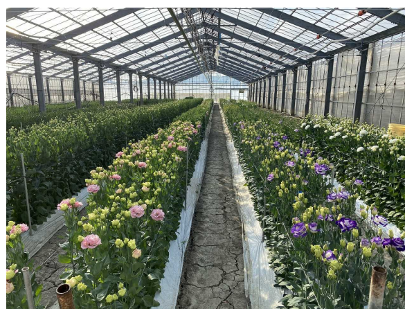
優良品種の選定 (トルコギキョウ今こそ生産加速事業)