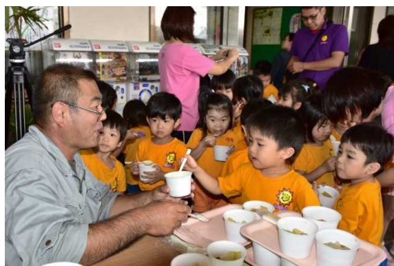
○とうがんの日消費拡大キャンペーン