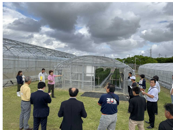
九州輪ギクサミットおきなわ大会 現地視察