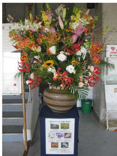
プロスポーツチームキャンプでの 県産花きフラワーアレンジメント展示 (南風原町)