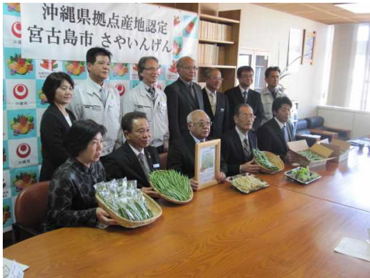
宮古島市:さやいんげん 平成31年1月23日認定