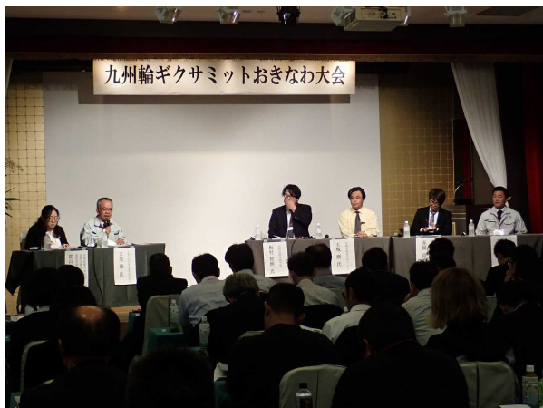
九州輪ギクサミットおきなわ大会 パネルディスカッション