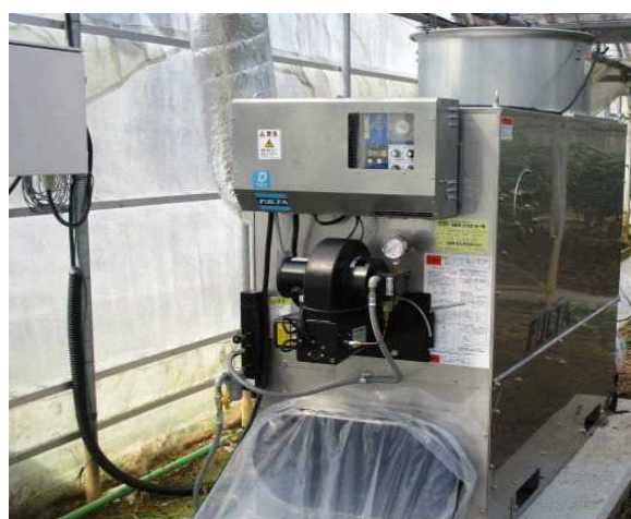
栽培施設内環境制御装置(加温機等) (令和元年度園芸産地機械整備事業)