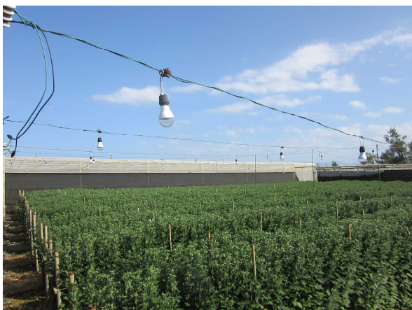
LED電照用電球資材の導入 (産地パワーアップ事業)