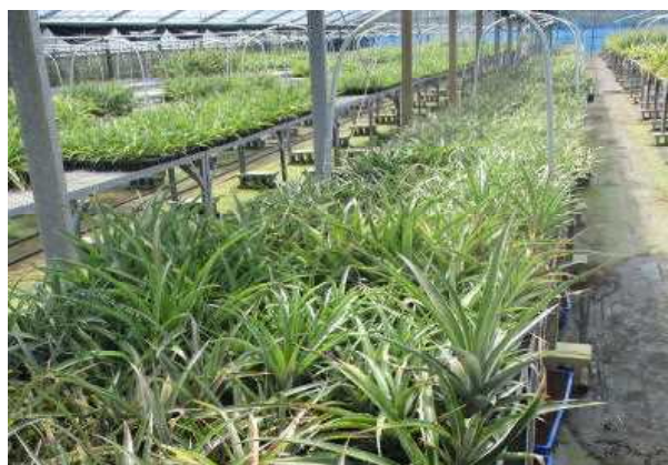
生食用パイナップル種苗増殖 (令和元年度いっぺーまーさんパイナップル強化事業)