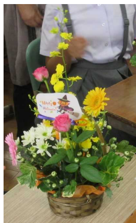
生徒が作成したフラワーアレンジメント