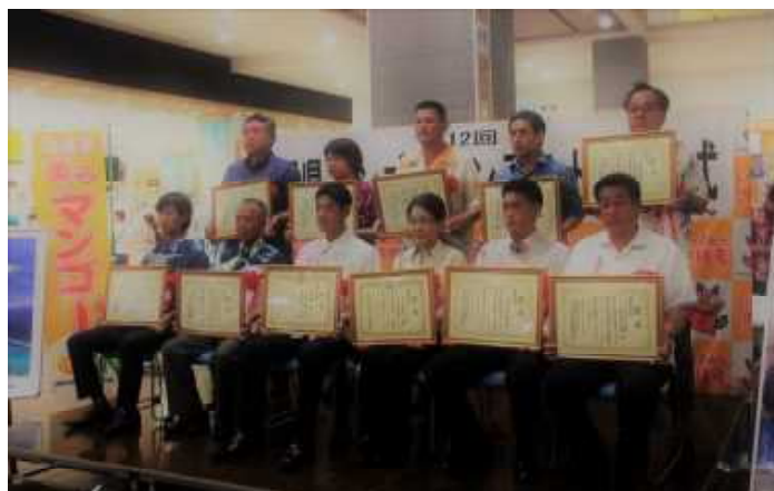
マンゴーコンテスト受賞者