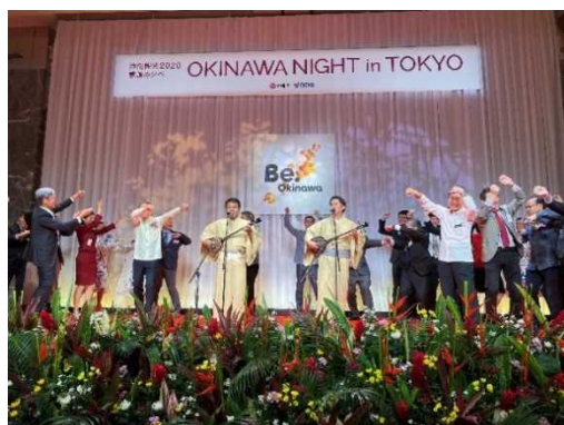
○「沖縄ナイト」への展示