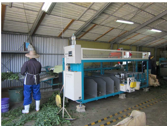
自動結束ロボット付き選花機の導入 (園芸産地機械整備事業)