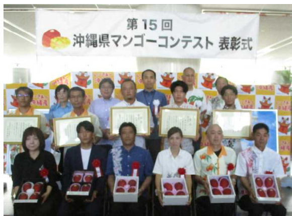
マンゴーコンテスト受賞者