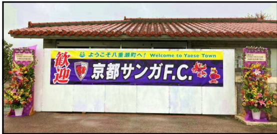
プロスポーツチームキャンプでの 県産花きフラワーアレンジメント展示 (八重瀬町)