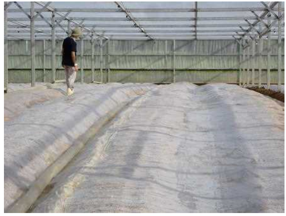
土壌消毒による秀品率・出荷率の改善の検討 (花き産地総合整備事業)