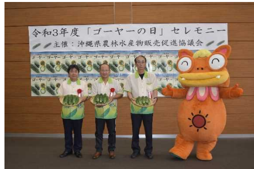
○ゴーヤーの日セレモニー