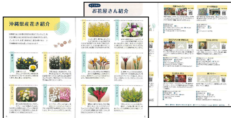
「おきなわのお花屋さんガイドブック」の作成、配布