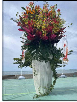
石垣市聖火リレー会場での県産花き装飾