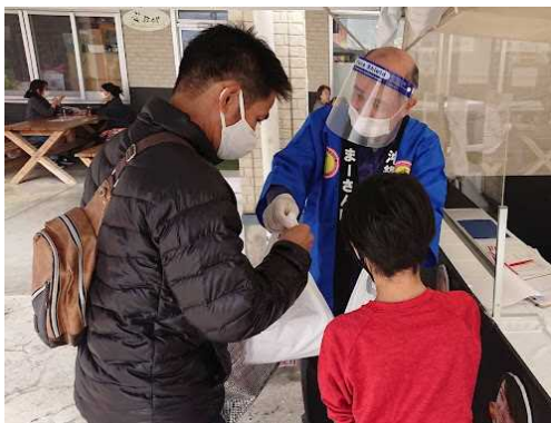
○県産食肉・たまご・牛乳等の特別販売販売会