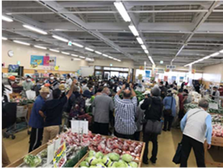
○とうがんの日消費拡大キャンペーン