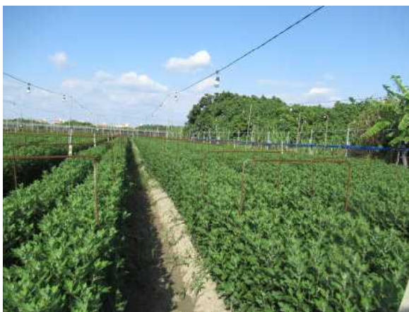
全量基肥型資材を活用した小ギク施肥体系の 検討 (園芸拠点産地生産拡大事業)