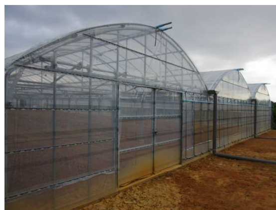
強化型耐候性施設(強化型パイプハウス) (令和3年度災害に強い高機能型栽培施設の導入推進事業)