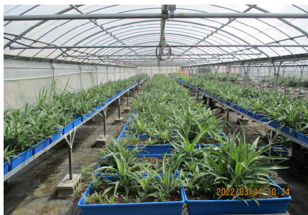
生食用パイナップル種苗増殖 (令和3年度いっぺーまーさんパイナップル強化事業)