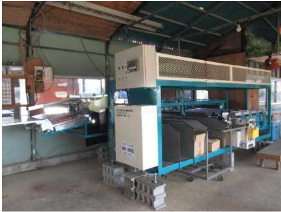
自動結束ロボット付き選花機の導入 (園芸産地機械整備事業)