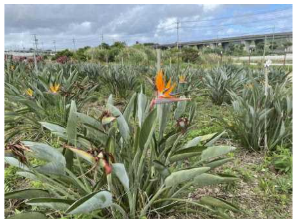
沖縄県園芸拠点産地優良活動表彰 南風原町花き拠点産地協議会 ストレリチア