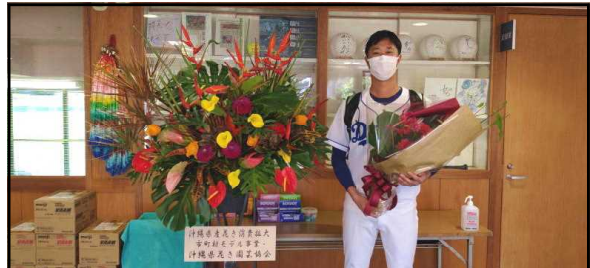
プロスポーツチームキャンプでの 県産花きフラワーアレンジメント展示、 花束贈呈 (読谷村)