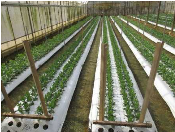
土壌消毒方法の検討 (トルコギキョウまだまだ生産加速事業)