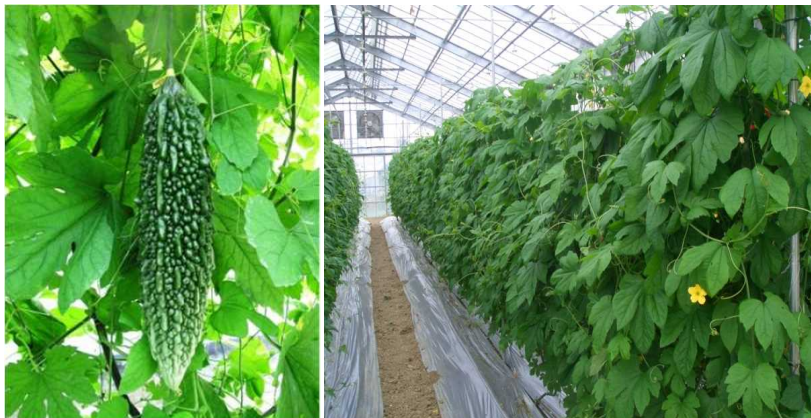
ゴーヤーの新品種「ていだみどり」