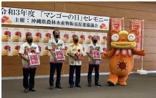
○マンゴーの日セレモニー