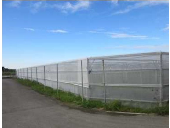
気象災害対応型平張施設の導入 (災害に強い高機能型栽培栽培施設の導入推進事業)