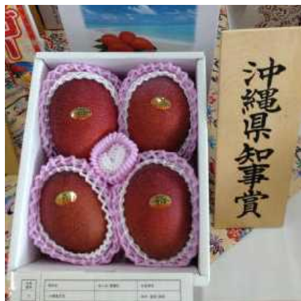
沖縄県知事賞 : 仲村 盛宏・政将氏 (沖縄市)