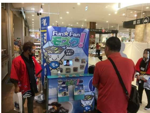
○モズクの日キャンペーン