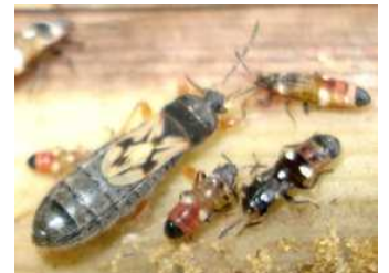
図.カンシャコバナネナガカメムシの短翅型成虫と幼虫