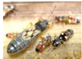
図カンシヤコバネナガカメムシの成虫と幼虫