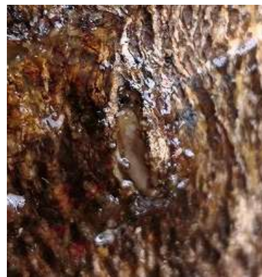
図3. 主幹に産み混まれた卵