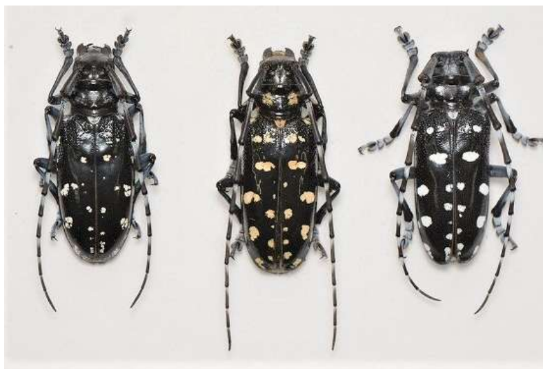
図1. ゴマダラカミキリ類成虫

左) ゴマダラカミキリ、中) オオシマゴマダラカミキリ、右) タイワンゴマダラカミキリ