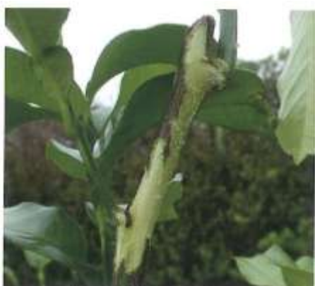
図2. 成虫による樹皮の食害（後食）

左) ゴマダラカミキリ、中) オオシマゴマダラカミキリ、右) タイワンゴマダラカミキリ