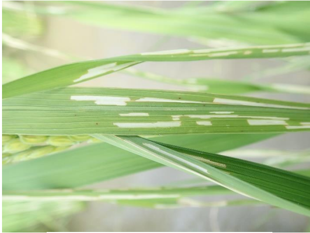
図3 幼虫による食害痕