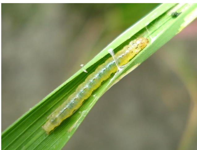
図1 コブノメイガ幼虫