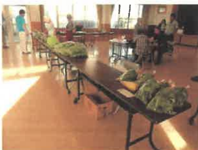
うまんちゅかつちん朝市